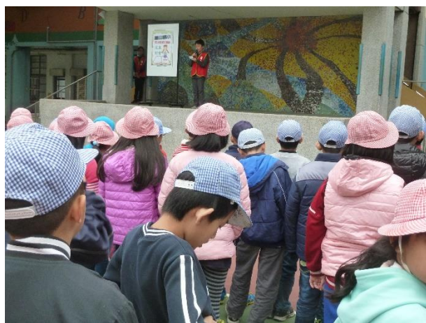
衛生環保科長 105. 12. 28