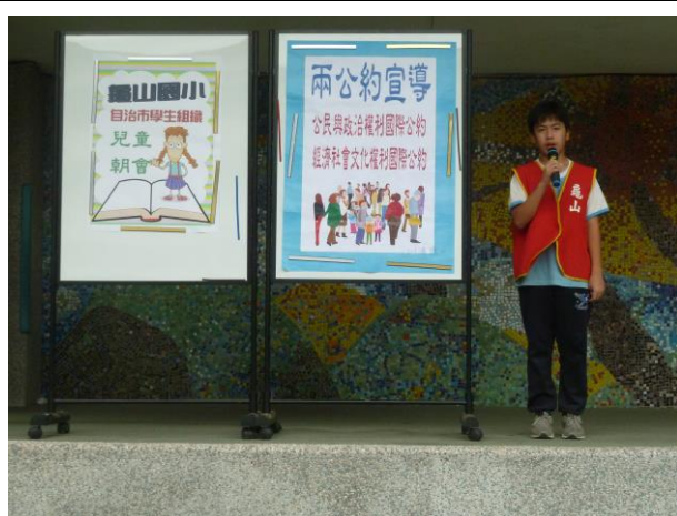
衛生環保科長 106. 05. 22