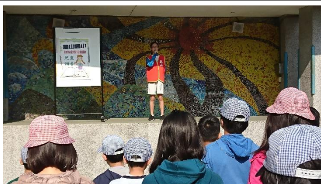
副自治市市長 106. 04. 05