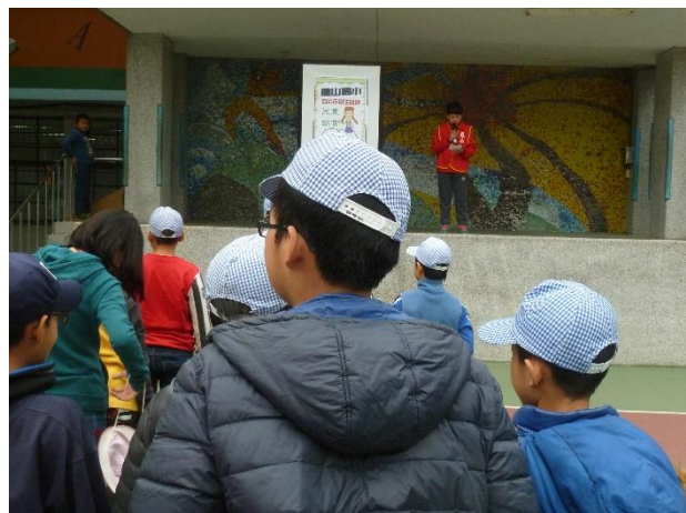
康樂委員會會長 105. 12. 14