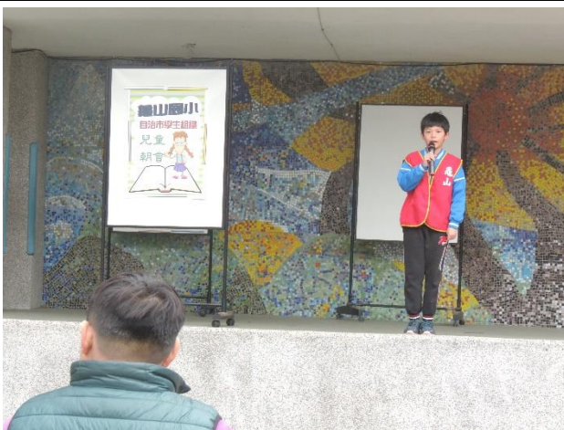
法治科長 106. 03. 15