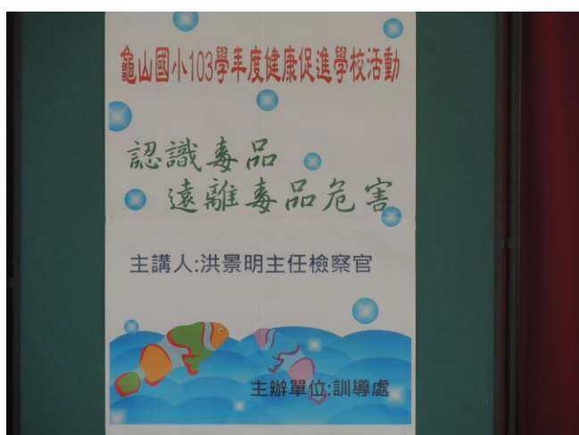
歡迎洪景明主任檢察官蒞校宣教