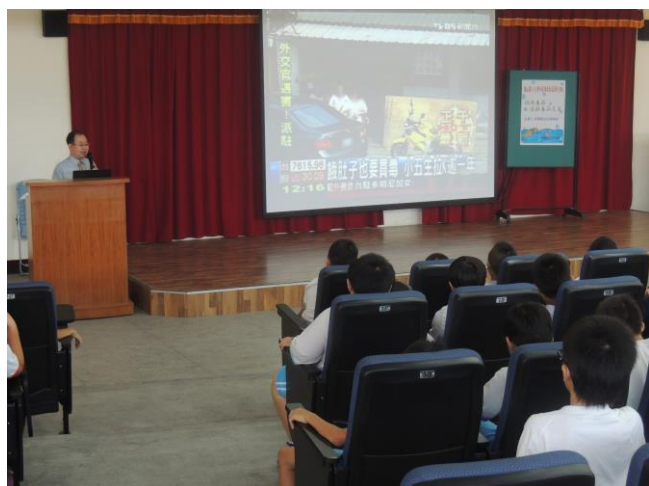
毒品危害不限於成人學童也受害