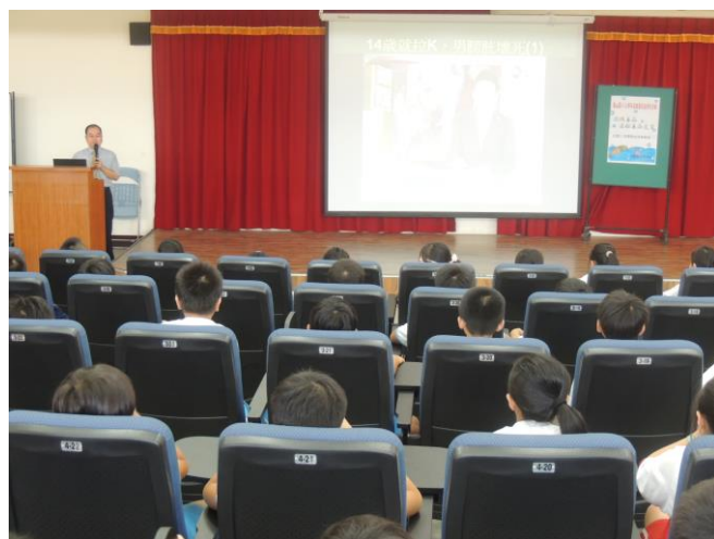
檢察官透過真實案例說明毒品危害