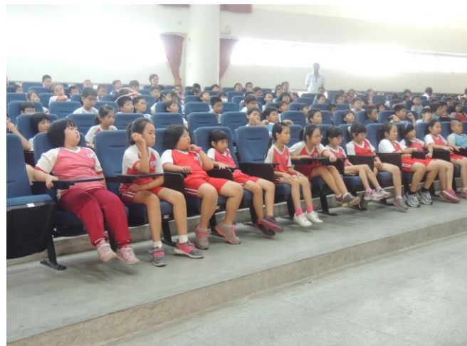
同學們聚精會神聆聽宣講