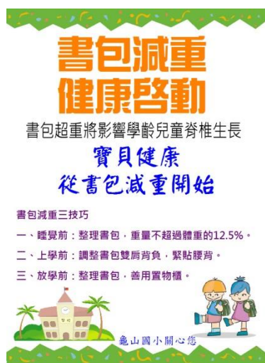
製作書包減重健康啟動宣導海報