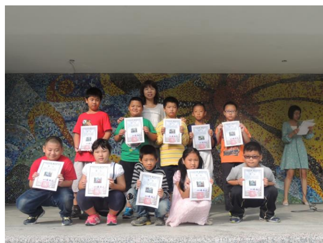
於兒童朝會表揚書包減重高手