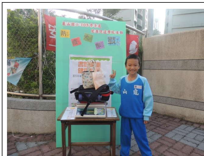
利用上學於校門實施書包減重抽測