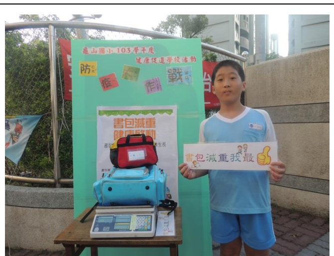
合格同學拍攝書包減重我最棒