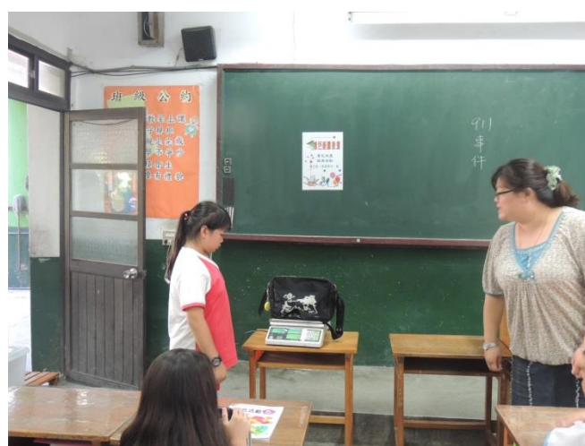
實施班級書包減重普測二