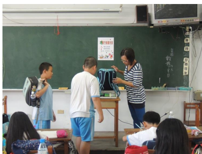
實施班級書包減重普測一