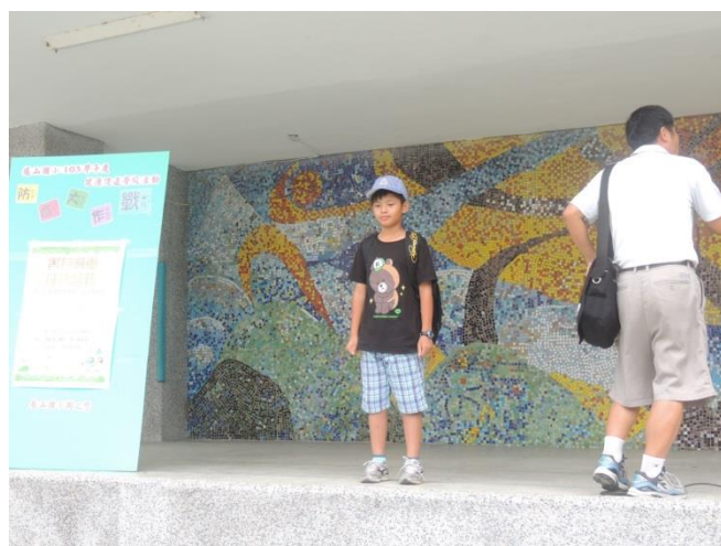
於兒童朝會宣導慎選書包種類