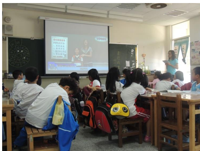
透過影音媒材宣導書包減重的重要