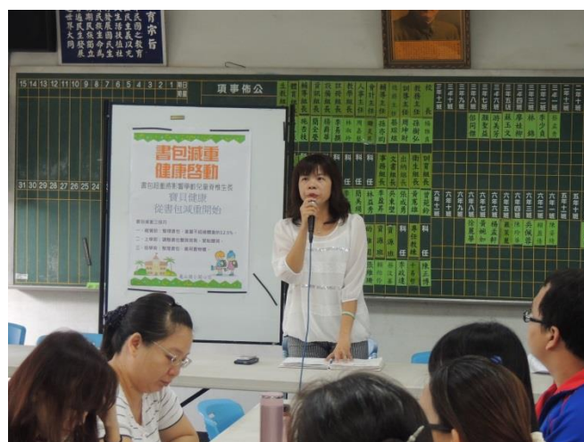
校長利用教師晨會宣導書包減重