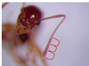
大頭家蟻屬錘節 3 節