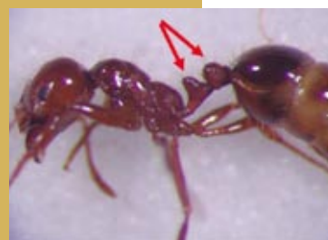
火蟻所屬之家蟻亞科