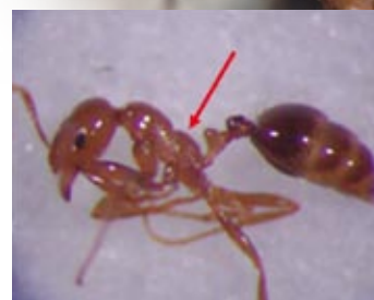
火蟻屬無前伸腹節齒