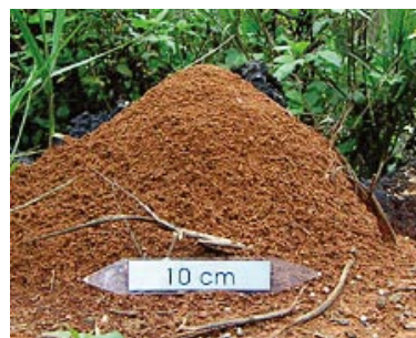
入侵紅火蟻成熟蟻巢

明顯隆起的蟻丘是最容易辨別入侵紅火蟻的方法，因為台灣約 270 種蟻中，沒有會築出高於地面 10 公分蟻丘的種類，蟻丘內部呈蜂巢狀結構，但需注意蟻巢初形成時並無明顯之蟻丘，易與其它種類蟻之蟻巢混淆。