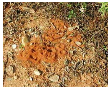
入侵紅火蟻初期蟻巢無明顯隆起