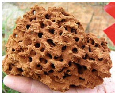
蟻巢內之蜂巢狀結構