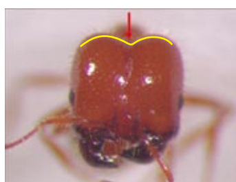
熱帶火蟻後頭部明顯凹陷