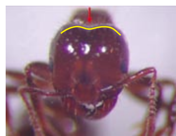
入侵紅火蟻後頭部平順無凹陷