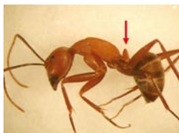
非火蟻之其它亞科蟻