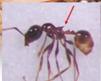
擬大頭家蟻屬有前伸腹節齒