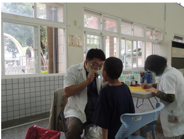
一、四年級健康檢查—口腔檢查