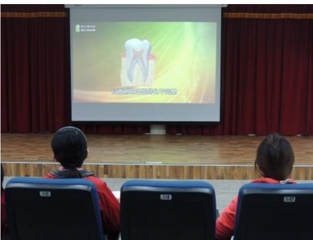
親職教育講座宣導白齒窩溝封填