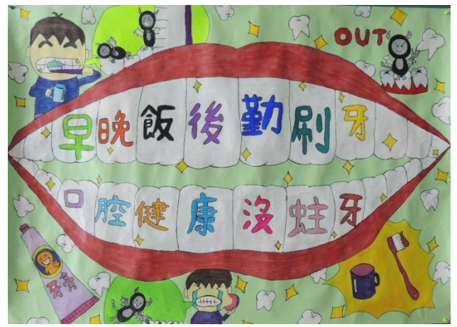
口腔衛生保健創意海報比賽優秀作品