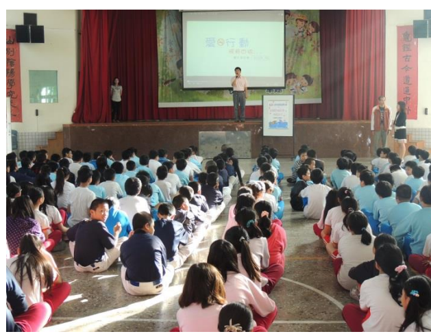
辦理防制菸害宣導活動