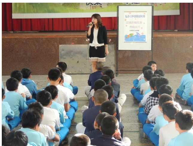
辦理防制菸害宣導活動