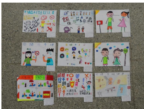
辦理防制菸害繪畫比賽