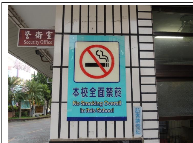
學校全面禁菸標示