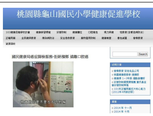
反菸拒檳網頁宣導