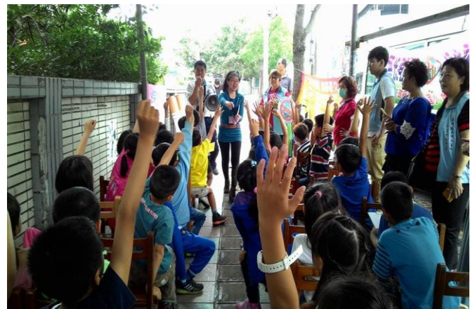
龜山區衛生所吳護理師進行宣導