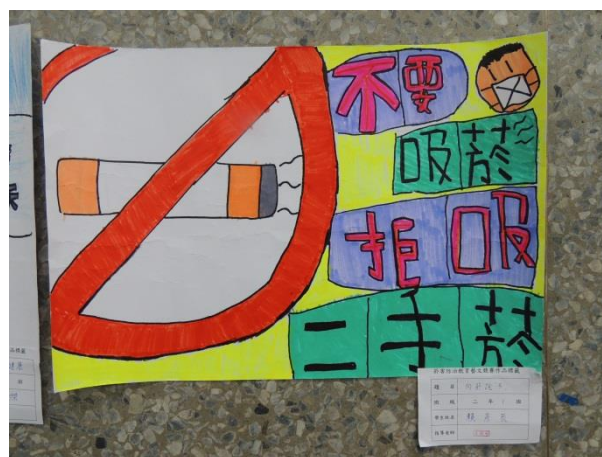
辦理防制菸害繪畫比賽