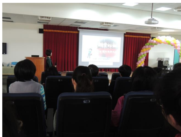
健康中心校護擔任導覽解說