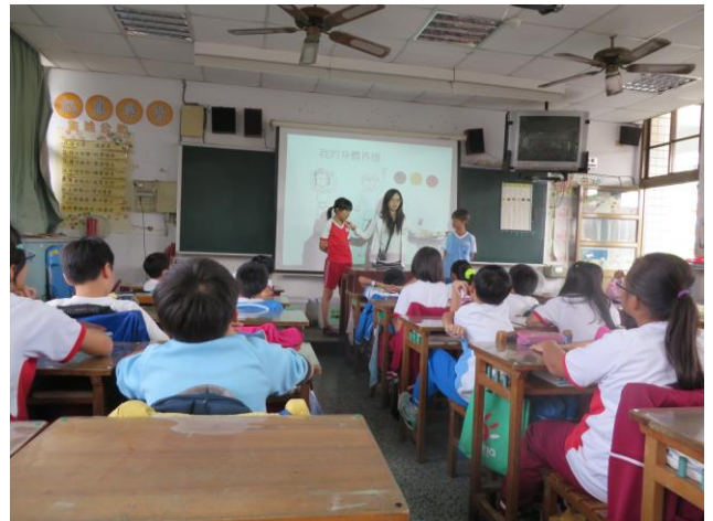
輔導教師設計「性別教育」課程入班輔導