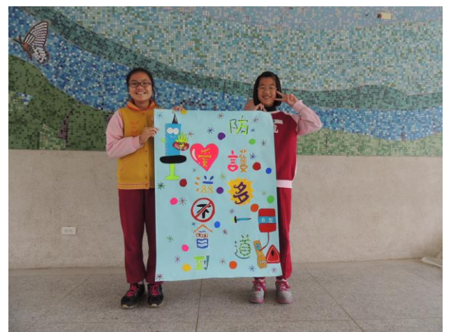
愛滋病防治創意標語海報比賽優秀作