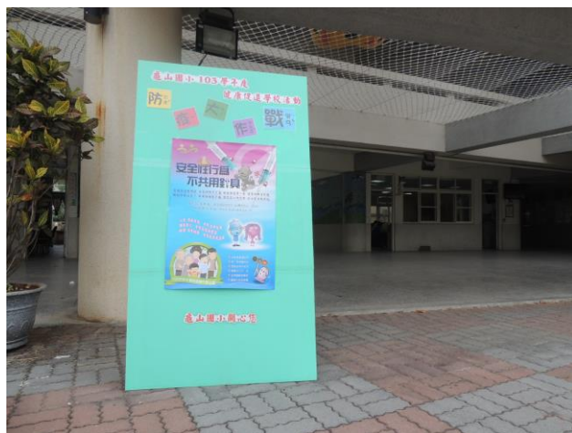
健康促進學校愛滋病防治立牌宣導