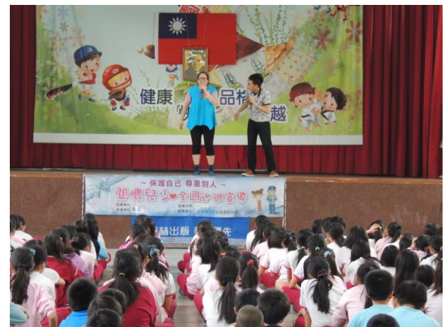
高年級「性侵害防治教育」--〈相聲〉