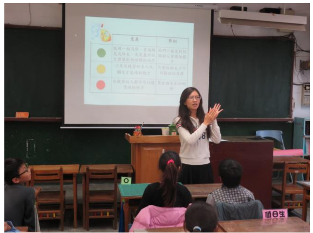
輔導教師設計「性別教育」課程入班輔導