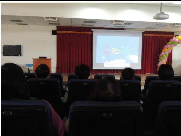
愛滋教育宣導--教師研習