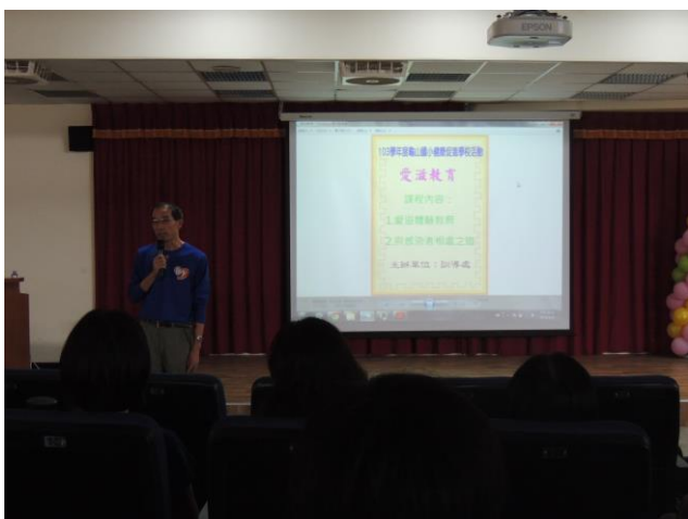
愛滋教育宣導--教師研習