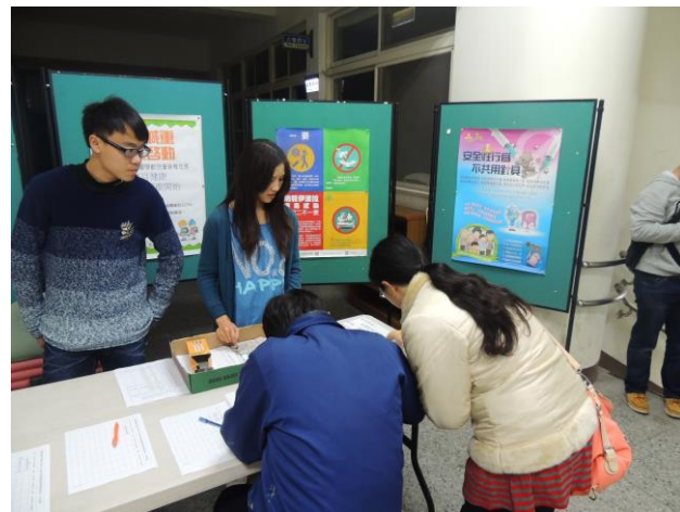
親職教育講座愛滋病防治海報宣導