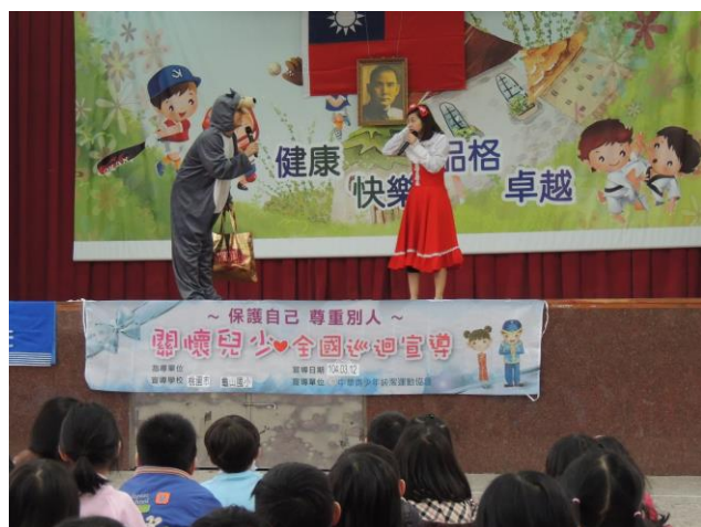
低年級「性侵害防治教育」--〈小紅帽〉