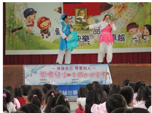
中年級「性別教育」--〈淑女還是鐵男〉