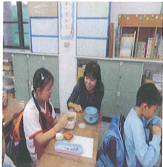
校長關心學生用餐情形