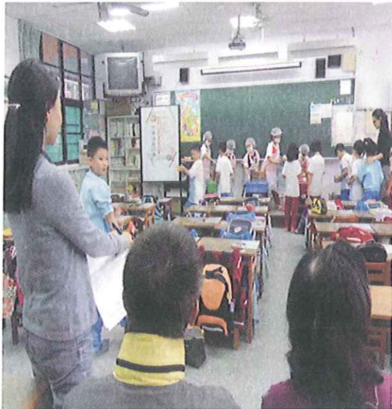
老師們在教室後面觀摩