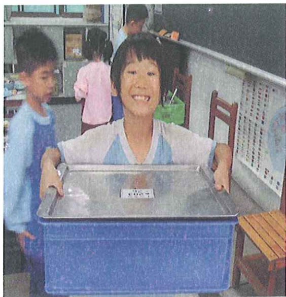
用餐後小心搬運餐盒