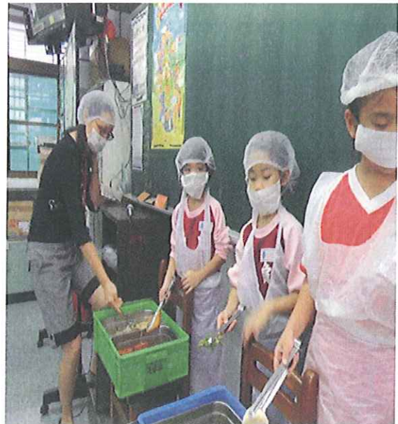
鍾老師從旁指導打菜人員