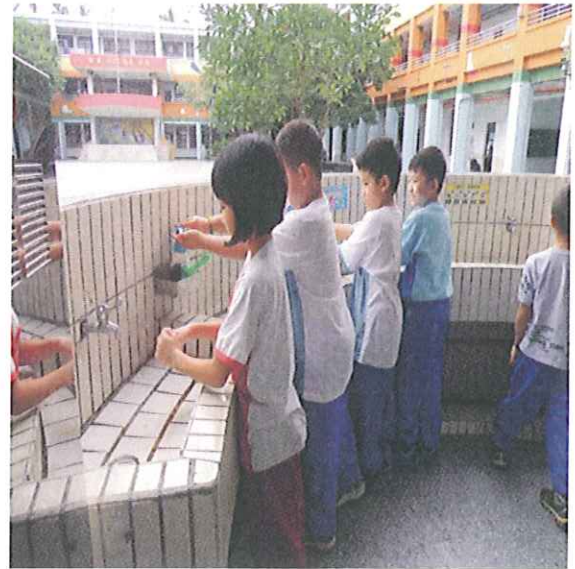
學生們依序去洗手