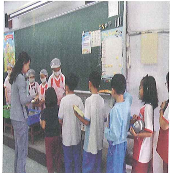
午餐秘書上前指導打菜工作