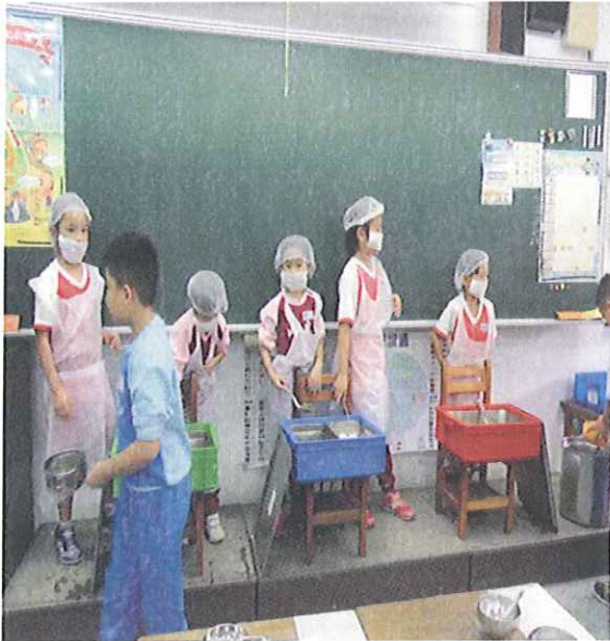
打菜人員全副武裝