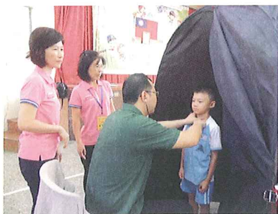
護理師和志工媽媽合作辦理