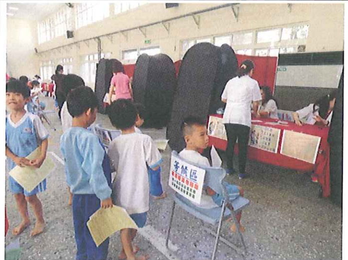
第一站 內兒物理檢查