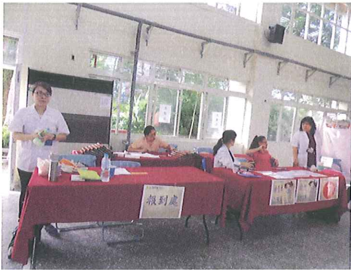
桃園敏盛醫院工作人員就位