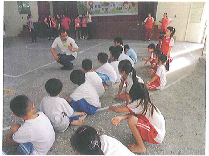
工作人員講解健檢流程