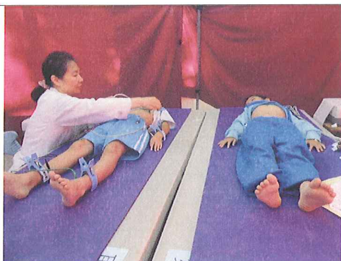
第六站 一年級心電圖檢查