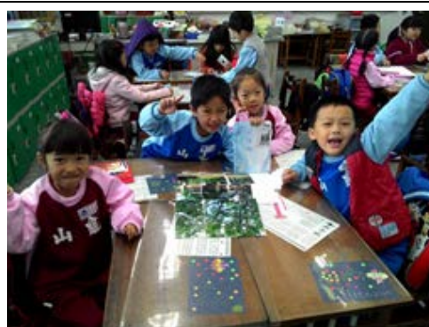
說明：項次 三 成果照片