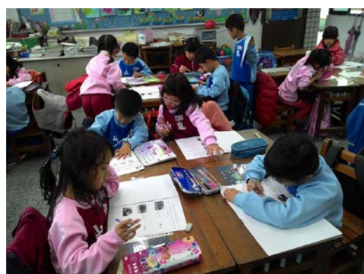
說明：項次 四 成果照片