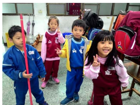
說明：項次 五 成果照片