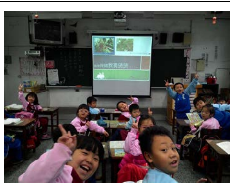
說明：項次 一 成果照片