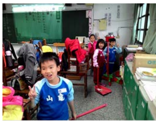
說明：項次 六 成果照片