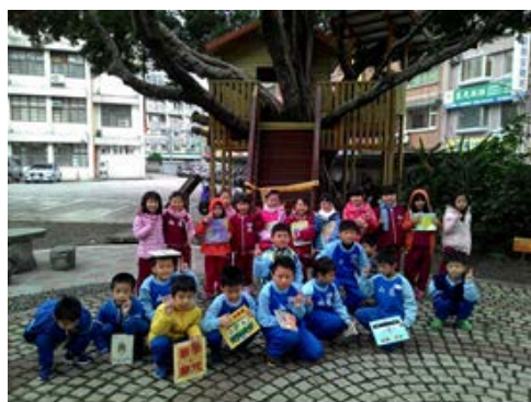
說明：項次 二 成果照片