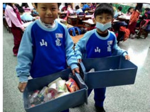
說明：項次 五 成果照片