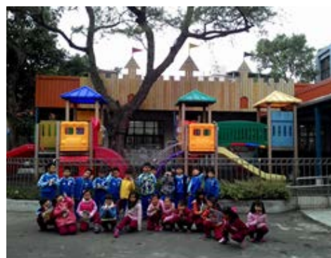
說明：項次 二 成果照片