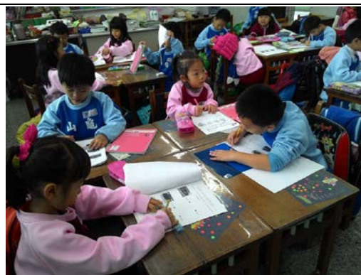
說明：項次 四 成果照片