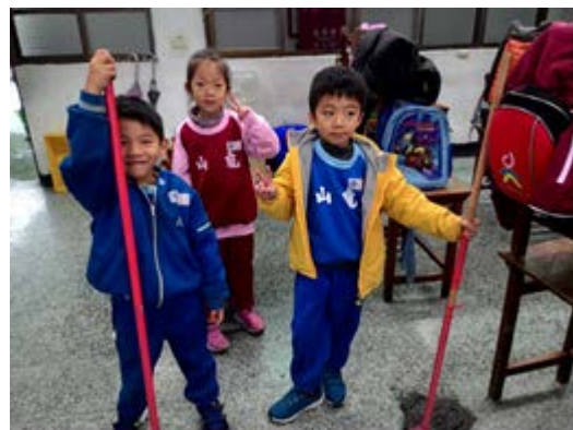
說明：項次 六 成果照片