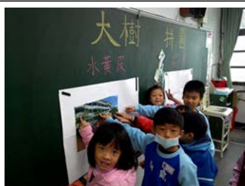
說明：項次 三 成果照片