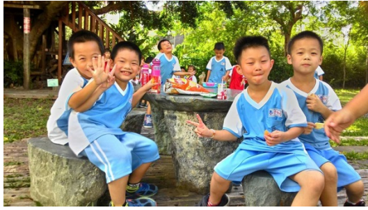
說明：項次 十 成果照片