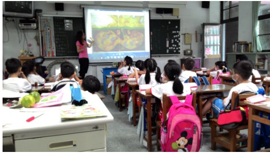
說明：項次 九 成果照片