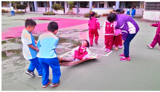
說明：項次 六 成果照片