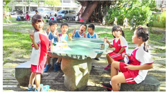
說明：項次 十 成果照片