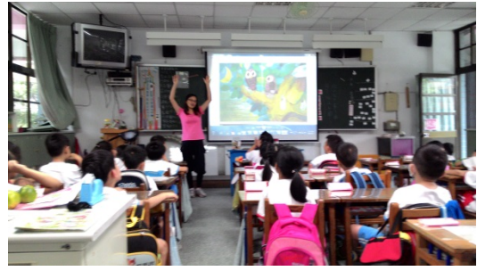
說明：項次 九 成果照片