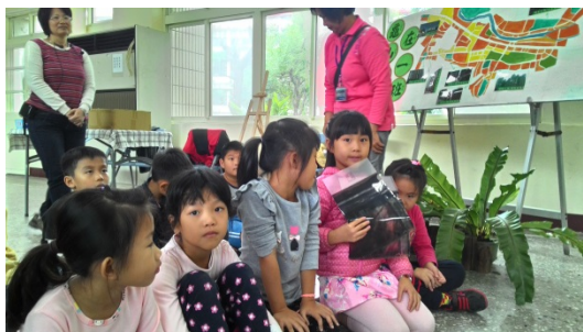
說明：項次 七 成果照片