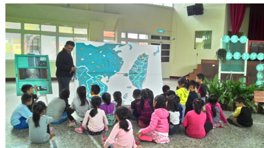
說明：項次 七 成果照片