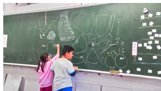
說明：項次 八 成果照片