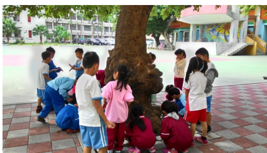
說明：項次 八 成果照片