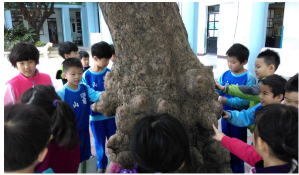
說明：項次 6 成果照片