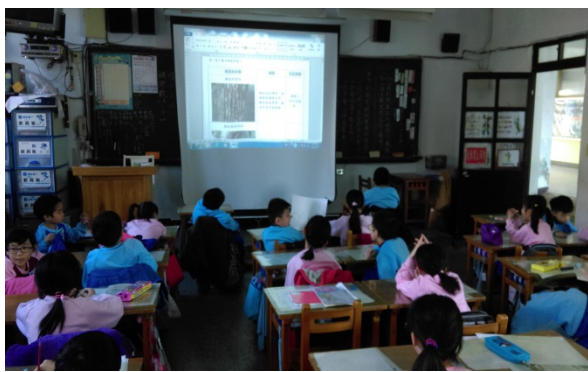
說明：項次 5 成果照片