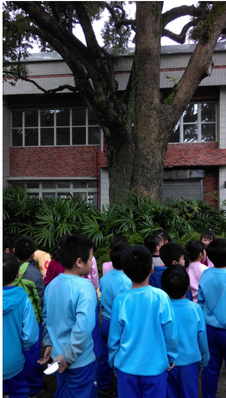
說明：項次 6 成果照片