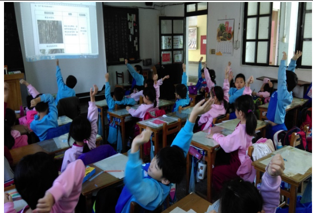
說明：項次 7 成果照片