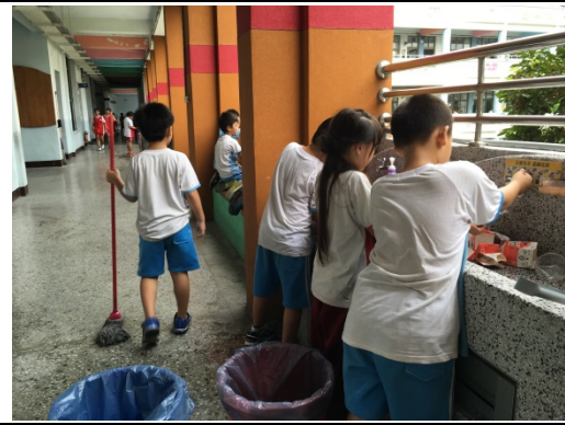
說明：項次 六 成果照片