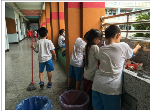
說明：項次 六 成果照片