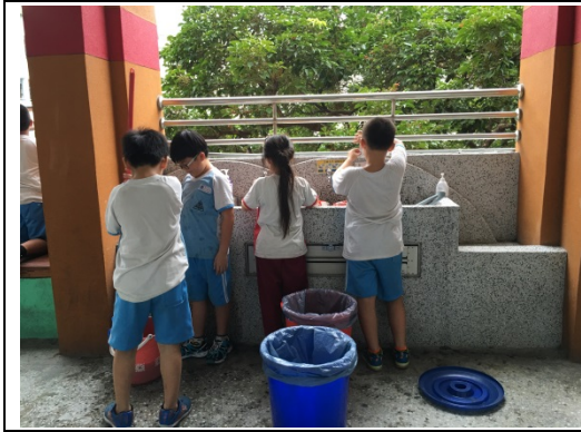
說明：項次 六 成果照片