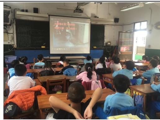
說明：項次 五 成果照片