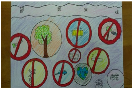
說明：「節能減碳教育」學生作品