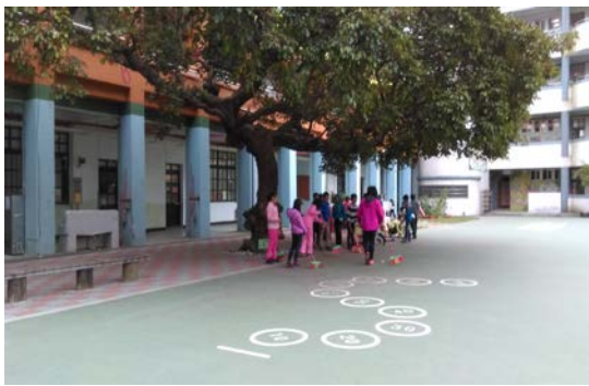
說明：校園環境打掃工作