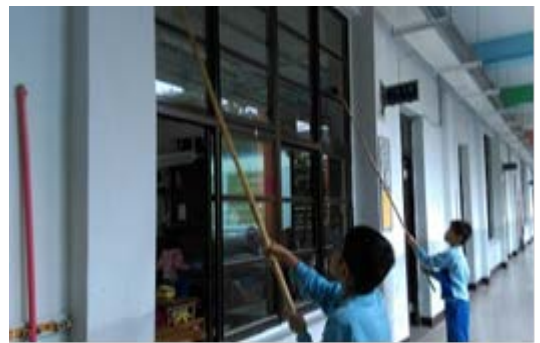
說明：校園環境打掃工作