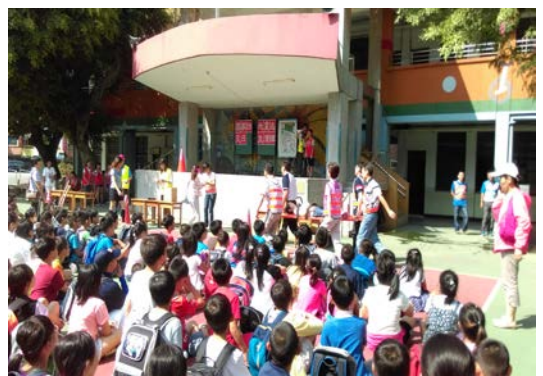
說明：921 地震逃生演練