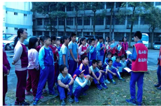
說明：校園巡禮~認識我們的校樹