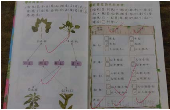
說明：自然課認識植物