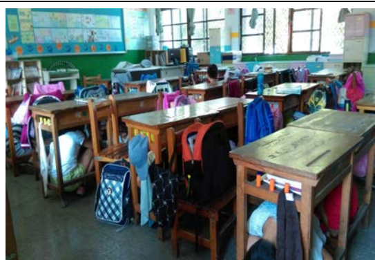
說明：921 地震逃生演練