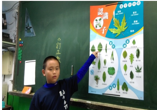
說明：自然課認識植物