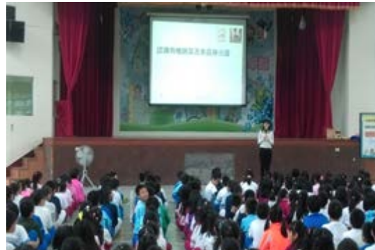
說明：三年級營養教育宣導