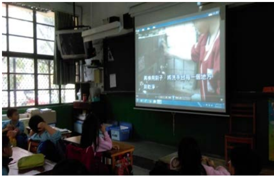
說明：「我是清潔達人」影片教學