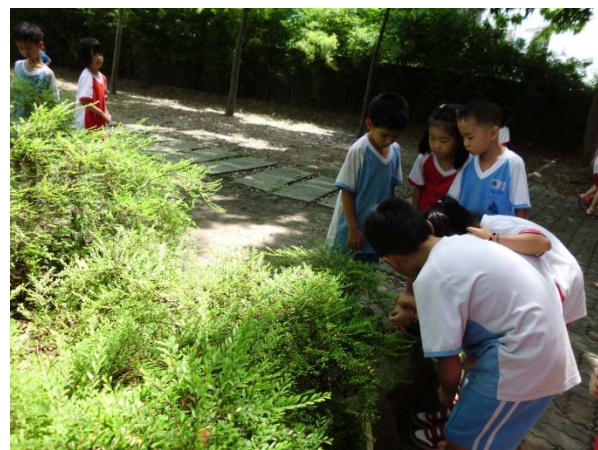
說明：項次 六 成果照片