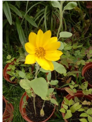
說明：項次 五 成果照片