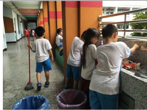
說明：項次六 成果照片