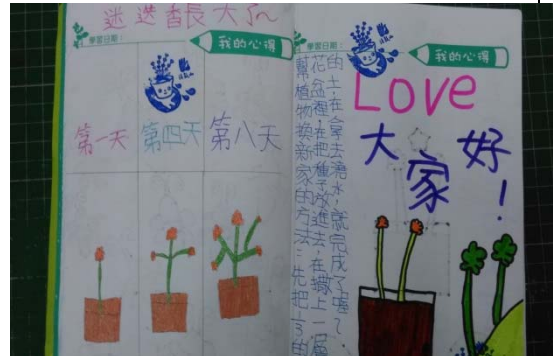
說明：項次 一 成果照片