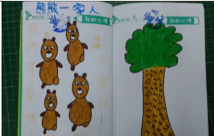
說明：項次 一 成果照片