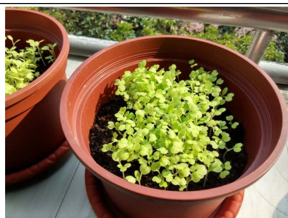
說明：項次 1 成果照片(小白菜幼苗)