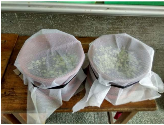
說明：項次 1 成果照片(小白菜套網)