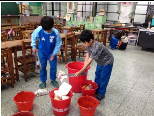
說明：項次 5 成果照片