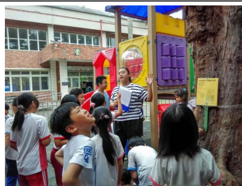
說明：項次 6 成果照片