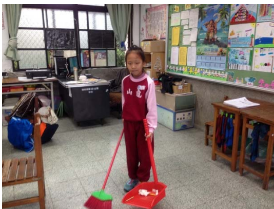
說明：項次 4 成果照片