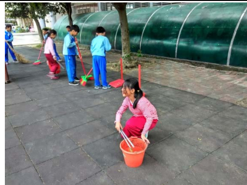
說明：項次 4 成果照片