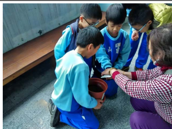
說明：項次 1 成果照片(播種)