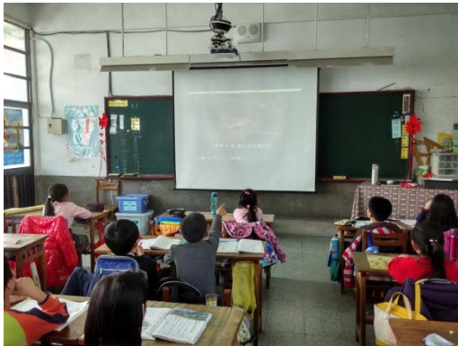
說明：項次 2 成果照片