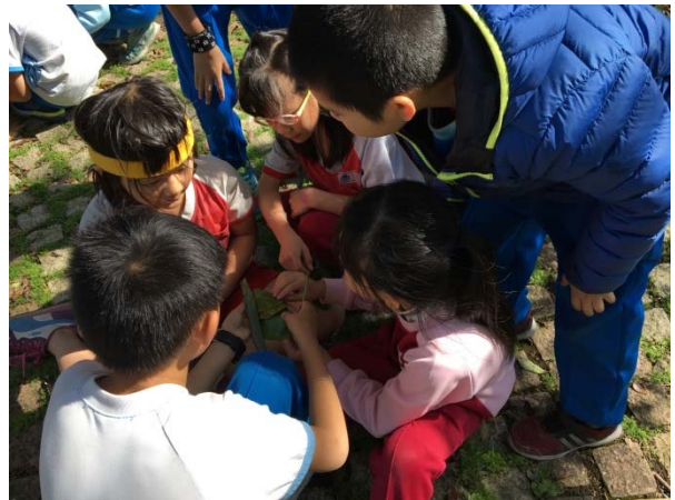
說明：項次 七 成果照片