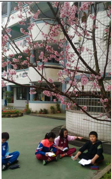
說明：項次 1 成果照片