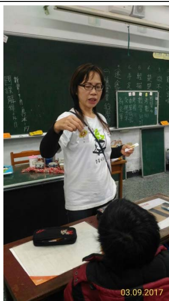
說明：項次 1 成果照片