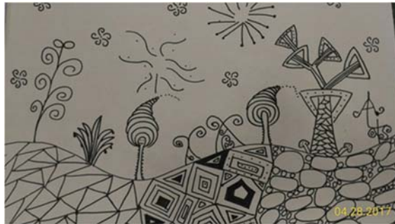
說明：項次_ 3 _ 成果照片