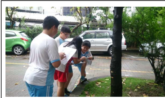
說明：項次一成果照片