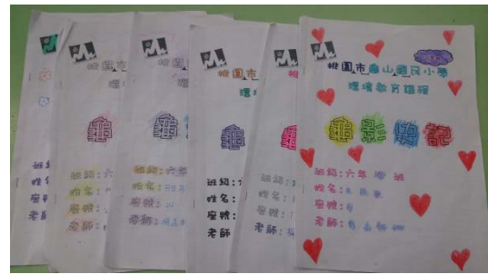
說明：項次一成果照片