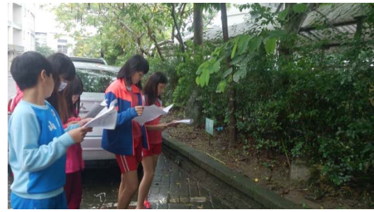
說明：項次一成果照片