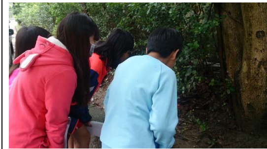
說明：項次一成果照片