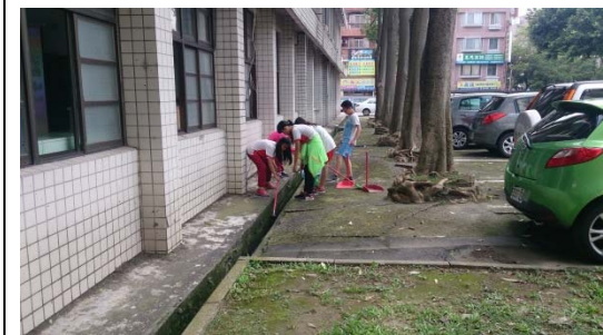
說明：項次二成果照片