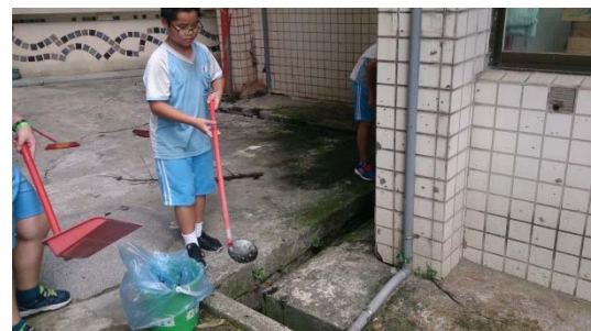
說明：項次二成果照片