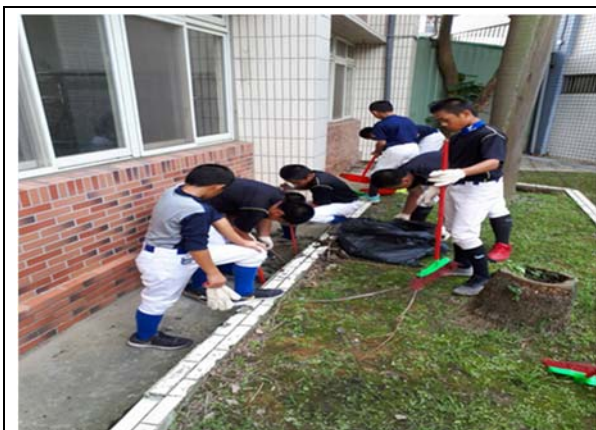
說明：項次 1 成果照片