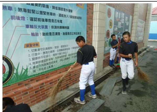
說明：項次 1 成果照片