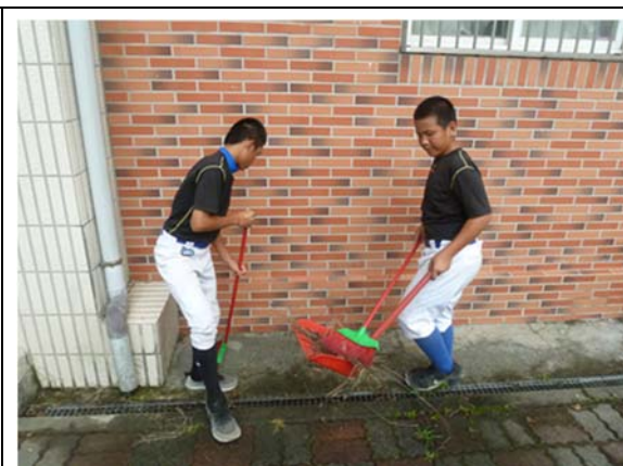
說明：項次 2 成果照片