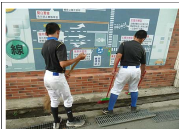
說明：項次__1__ 成果照片