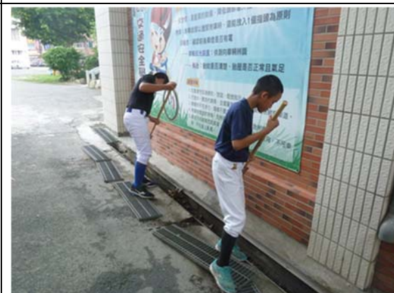
說明：項次 2 成果照片