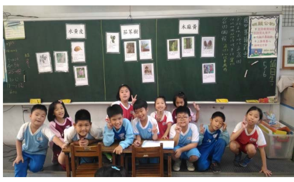
說明：項次 3 成果照片