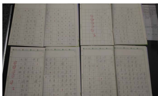
說明：項次 5 成果照片