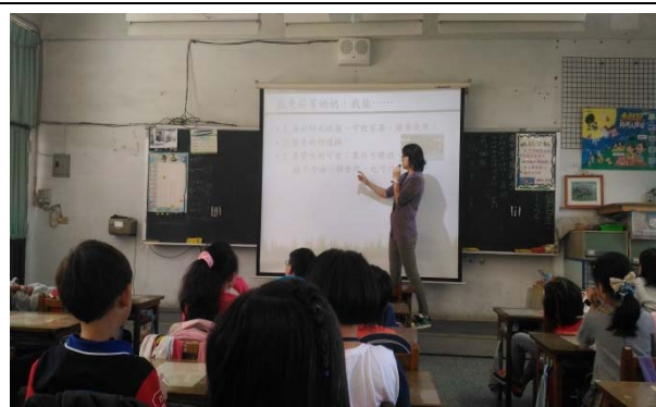
說明：項次 1 成果照片