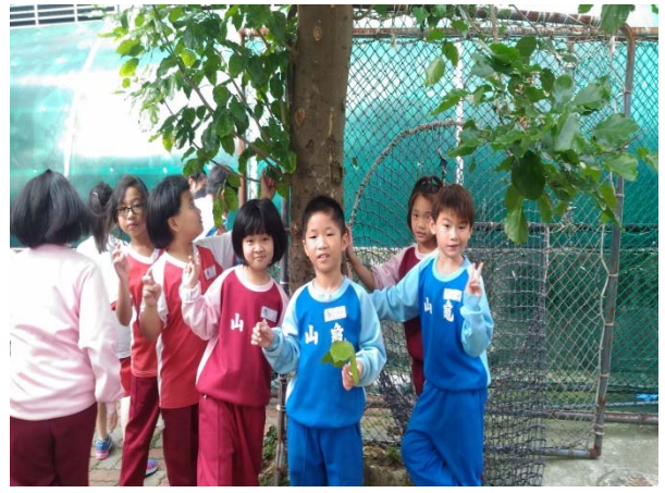
說明：項次 2 成果照片