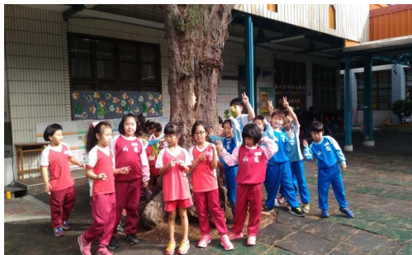
說明：項次 2 成果照片