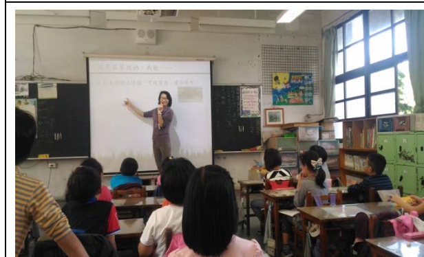
說明：項次 1 成果照片