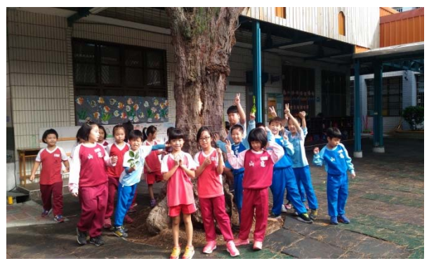
說明：項次 2 成果照片