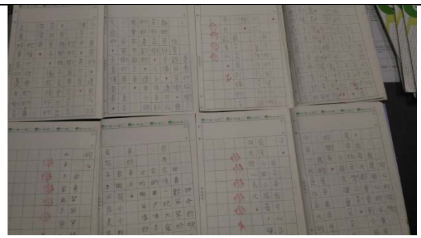
說明：項次 5 成果照片