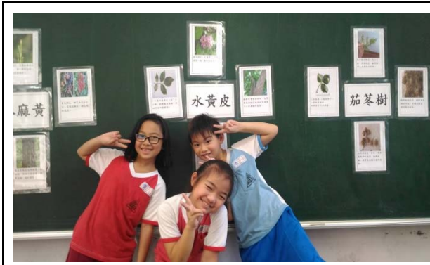
說明：項次 3 成果照片