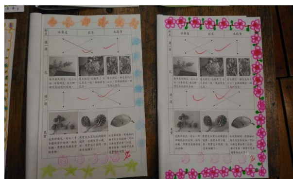
說明：項次 4 成果照片