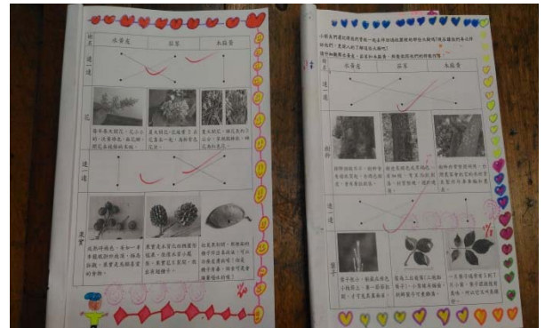
說明：項次 4 成果照片