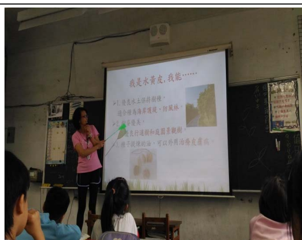
說明：項次 1 成果照片