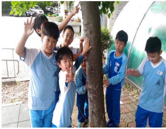
說明：項次 2 成果照片