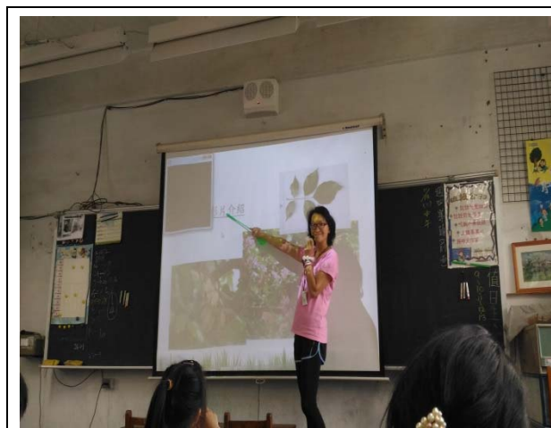
說明：項次 1 成果照片