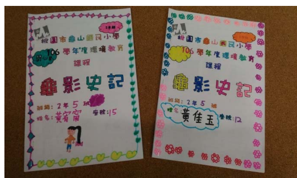
說明：項次 4 成果照片