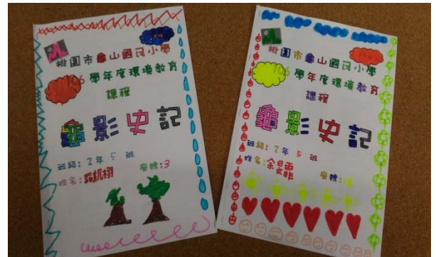
說明：項次 4 成果照片