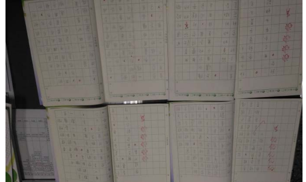
說明：項次 5 成果照片