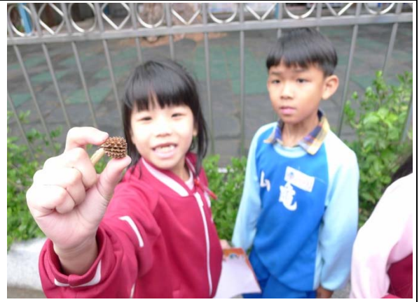
說明：項次 3 成果照片