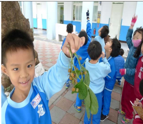
說明：項次 3 成果照片