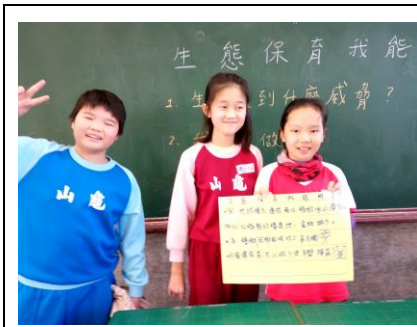
說明：項次 四 成果照片 各組踴躍上台發表