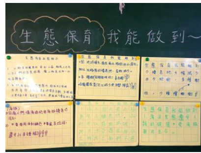
說明：項次 四 成果照片 各組成果分享與展示