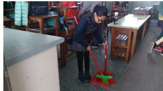
說明：項次二成果照片