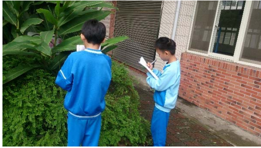
說明：項次一成果照片