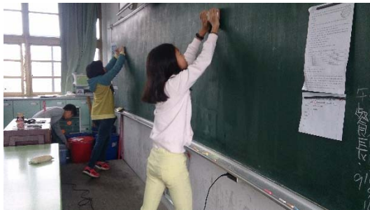
說明：項次二成果照片