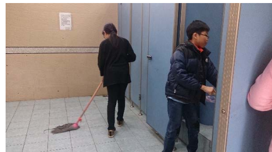
說明：項次三成果照片