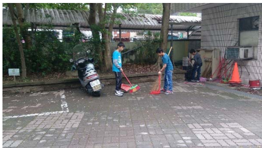
說明：項次三成果照片