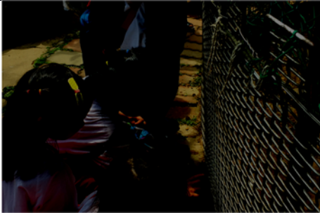
說明：項次 7 成果照片