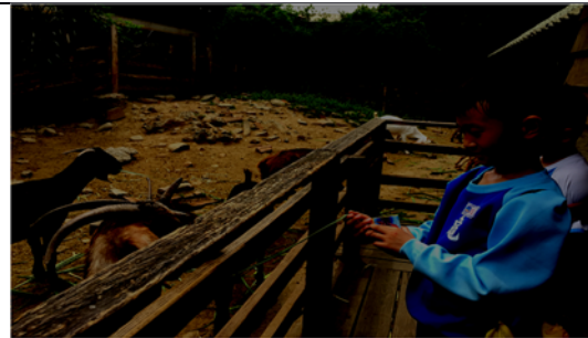
說明：項次 8 成果照片