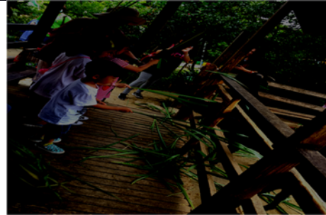
說明：項次 8 成果照片