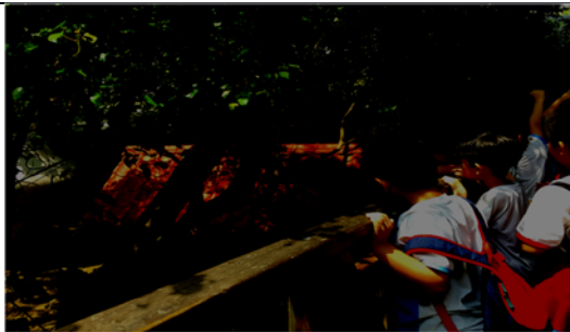
說明：項次 9 成果照片