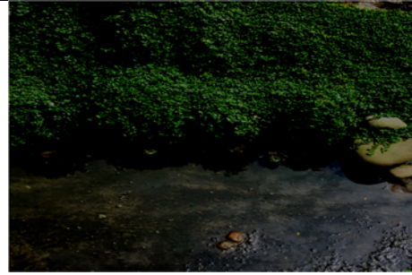
說明：項次 6 成果照片