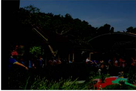
說明：項次 6 成果照片