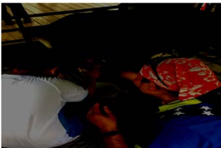
說明：項次 10 成果照片