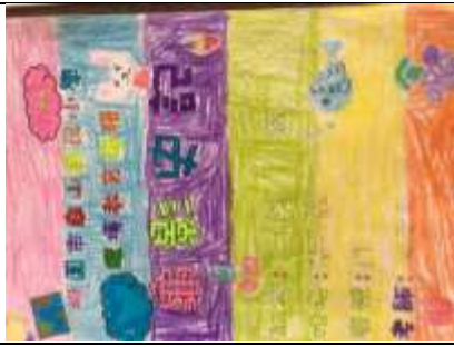
說明：項次三~1 成果照片