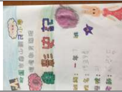
說明：項次三~2 成果照片