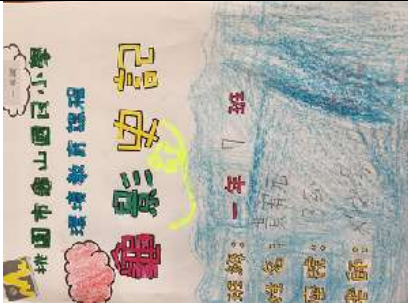
說明：項次三~3 成果照片