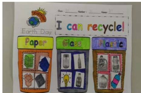
說明：項次 九 成果照片