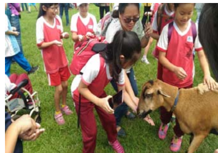
說明：項次 十 成果照片