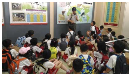
說明：項次 十 成果照片