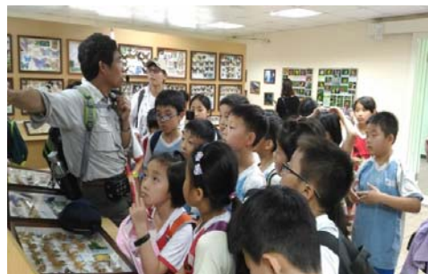
說明：項次 十 成果照片