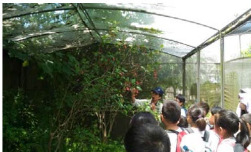
說明：項次 十 成果照片