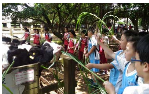
說明：項次 十 成果照片