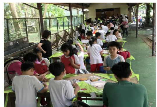
說明：項次 5 成果照片