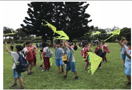
說明：項次 5 成果照片