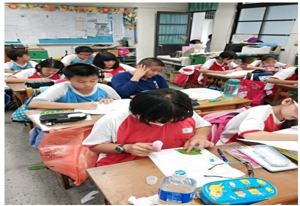
說明：項次 五 成果照片