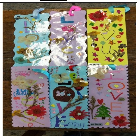
說明：項次 五 成果照片