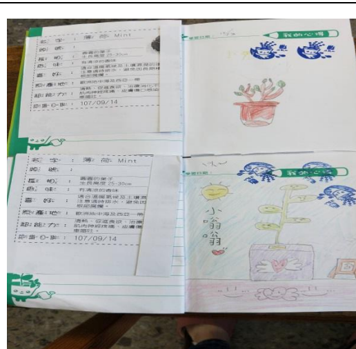
說明：項次 六 成果照片