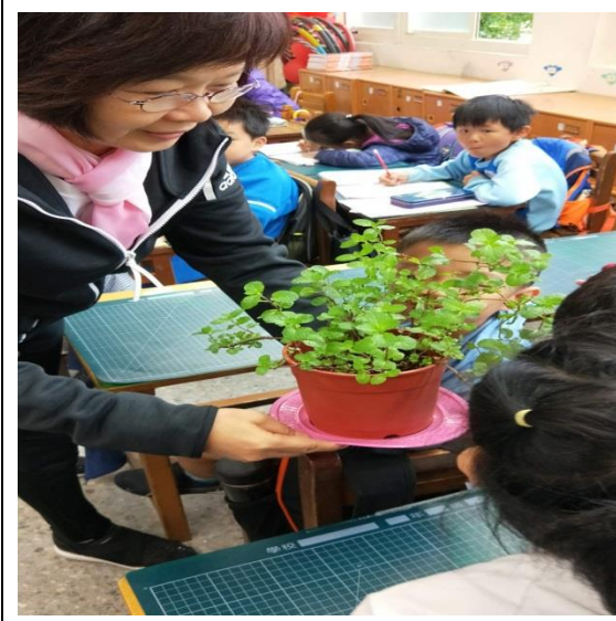
說明：項次 二 成果照片