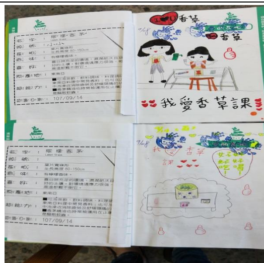
說明：項次 六 成果照片