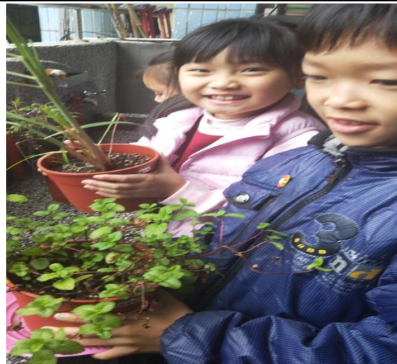
說明：項次 六 成果照片