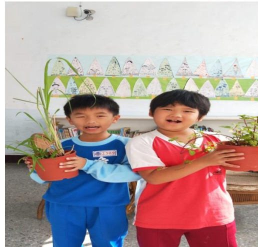
說明：項次 六 成果照片