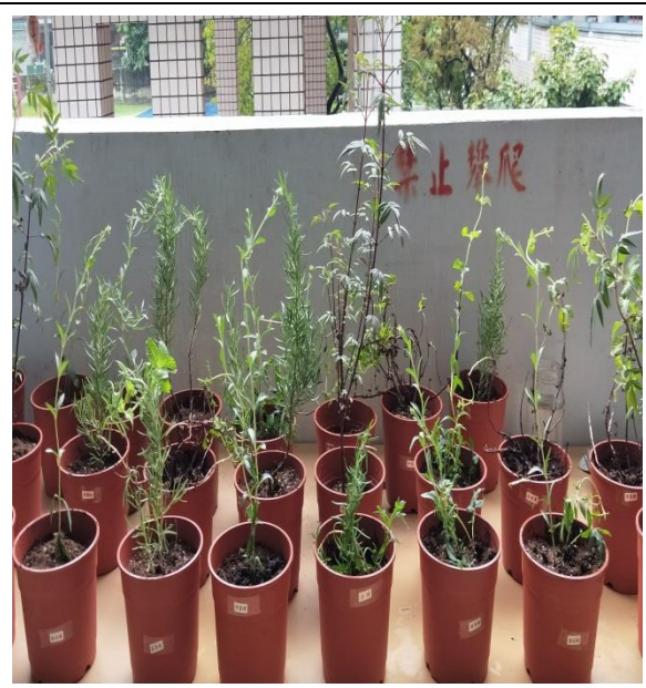
說明：項次 一 成果照片