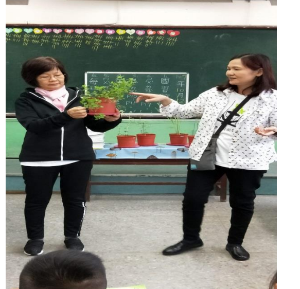
說明：項次 二 成果照片