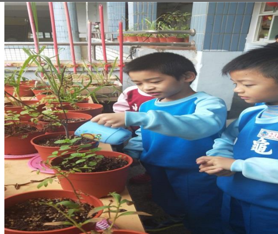
說明：項次 六 成果照片