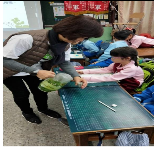
說明：項次 六 成果照片