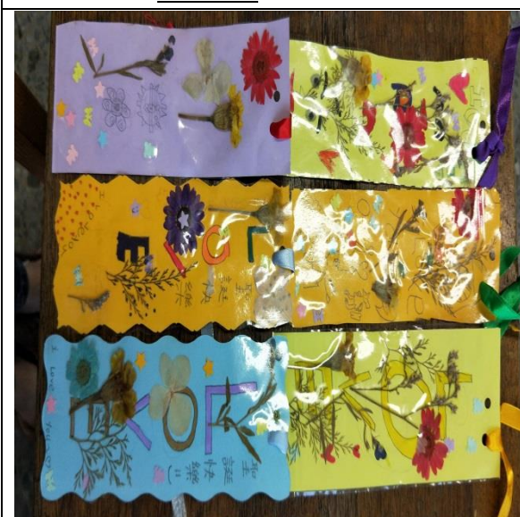
說明：項次 五 成果照片