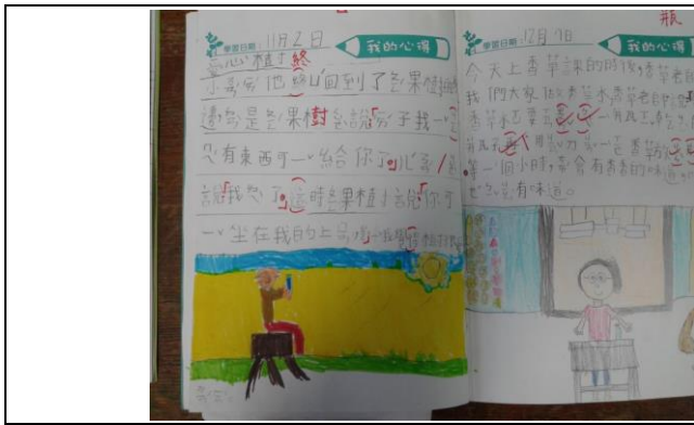
說明：項次三：聽小故事寫日誌