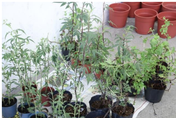
說明：項次二：觀察香草根莖葉