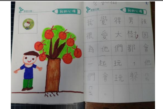
說明：項次三：聽小故事寫日誌