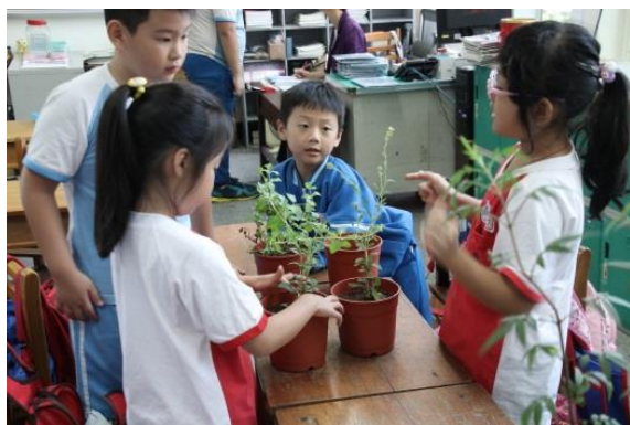
說明：項次二：動手種香草