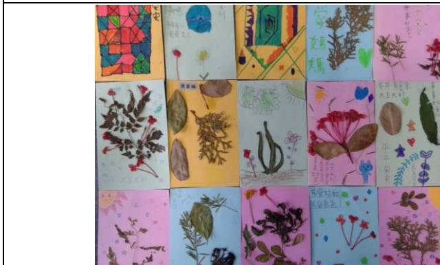
說明：項次六：做一張香草卡片