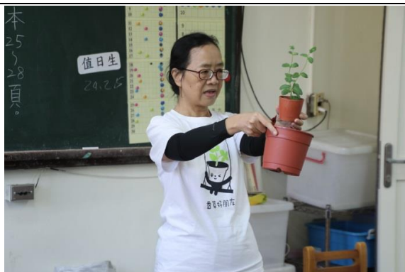
說明：項次二：動手種香草