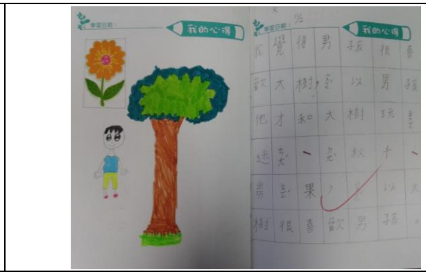
說明：項次三：聽小故事寫日誌