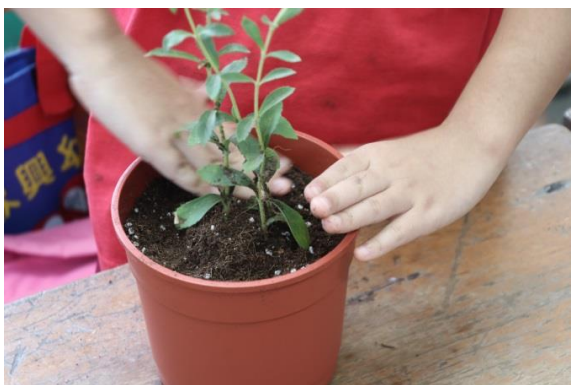
說明：項次二：動手種香草