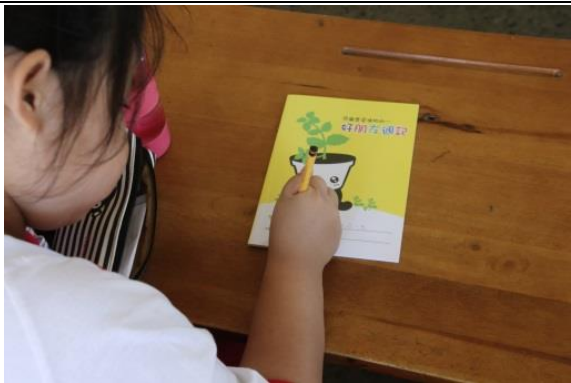
說明：項次三：聽小故事寫日誌