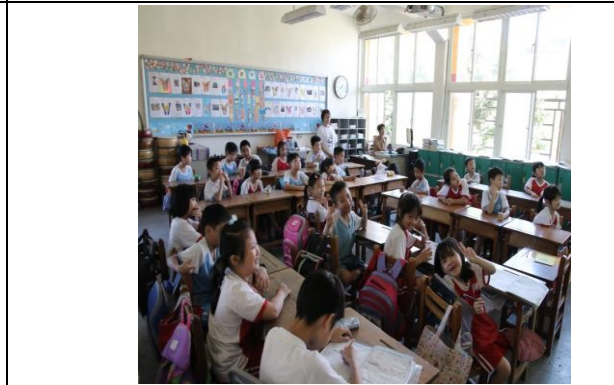
說明：項次五：武林高手八式動禪