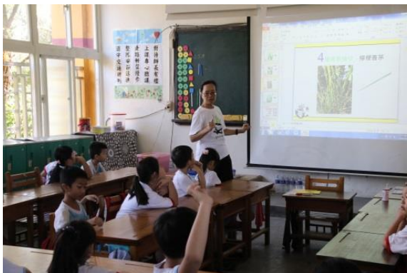
說明：項次一：認識香草好朋友