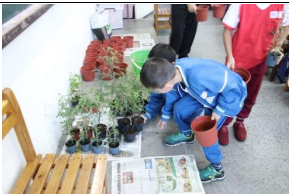
說明：項次二：動手種香草