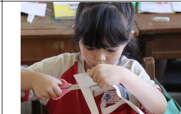
說明：項次六：做一張香草卡片