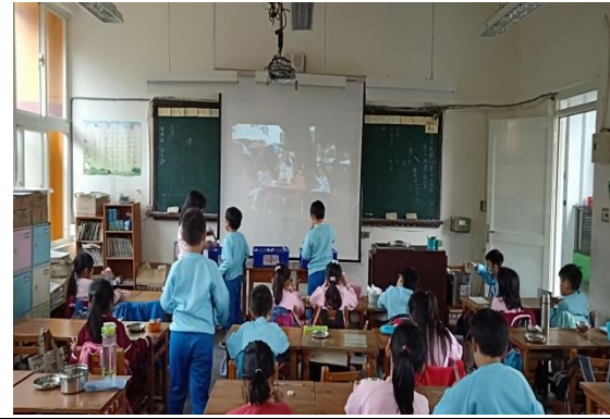
說明：項次 4 成果照片