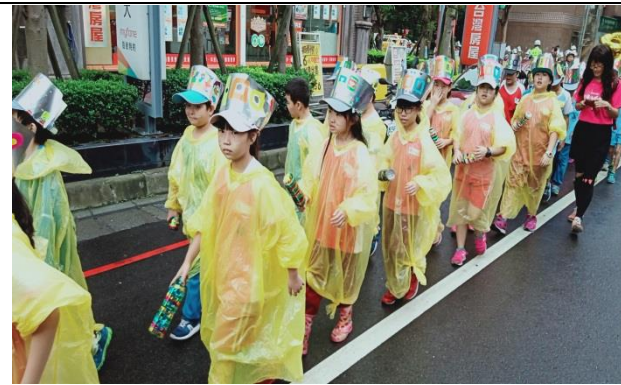
說明：項次 2 成果照片