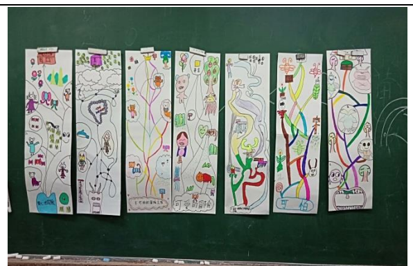
說明：項次 6 成果照片