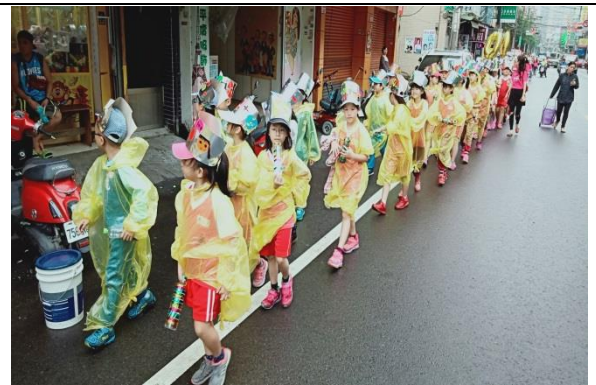
說明：項次 2 成果照片