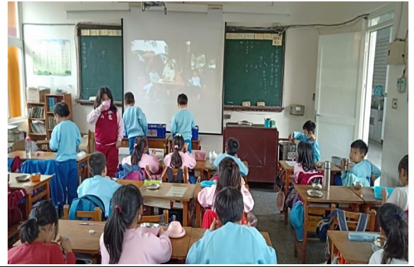
說明：項次 4 成果照片