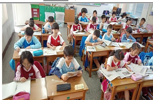
說明：項次 3 成果照片