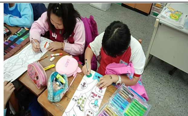
說明：項次 5 成果照片