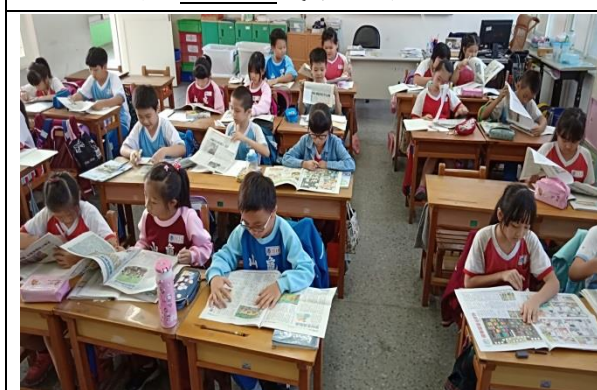
說明：項次 3 成果照片