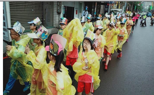
說明：項次 2 成果照片