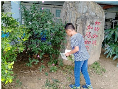
說明：項次 1 成果照片(學生觀察)