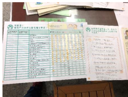
說明：項次 2 成果照片(家事手冊成果)