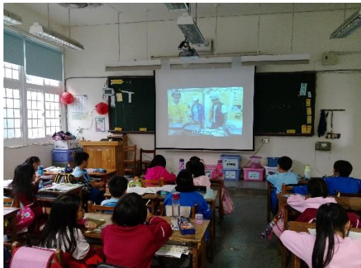
說明：項次 4 成果照片(欣賞昆蟲影片)