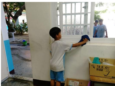
說明：項次 2 成果照片(學生實作)