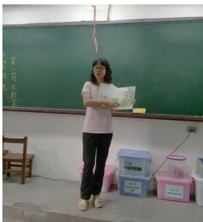
說明：項次 1 成果照片(老師導讀)