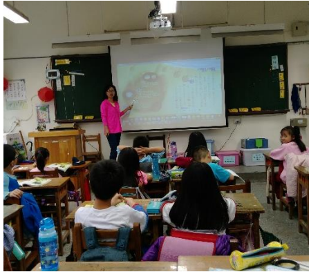
說明：項次 3 成果照片(老師上課)