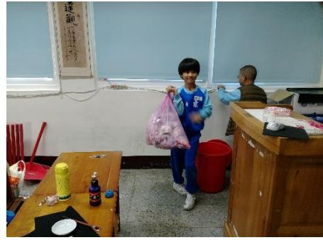
說明：項次 2 成果照片(學生實作)