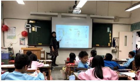
說明：項次 2 成果照片(老師上課)