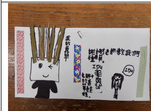
說明：項次 三 成果照片