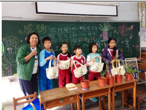
說明：項次 四 成果照片