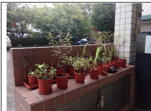
說明：項次 一 照片