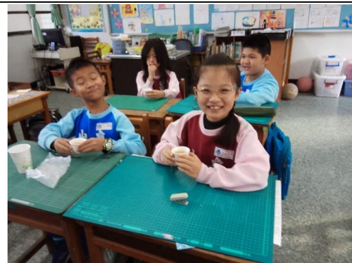
說明：項次 四 成果照片