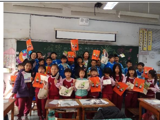
說明：項次 四 成果照片