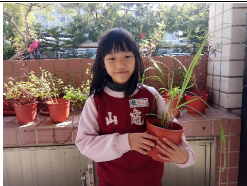
說明：項次 四 成果照片