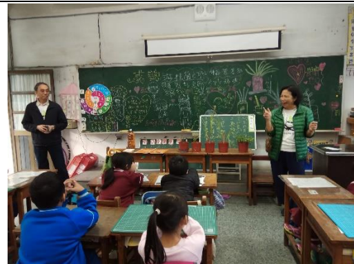
說明：項次 四 成果照片