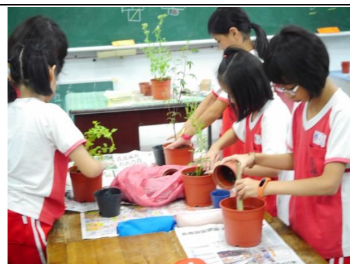
說明：項次二成果照片