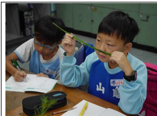
說明：項次一成果照片