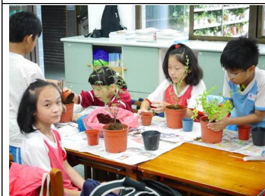
說明：項次二成果照片