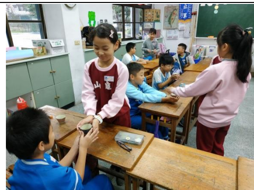
說明：項次 八 成果照片