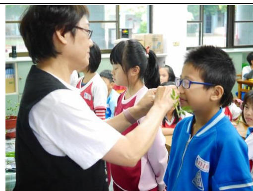
說明：項次一成果照片