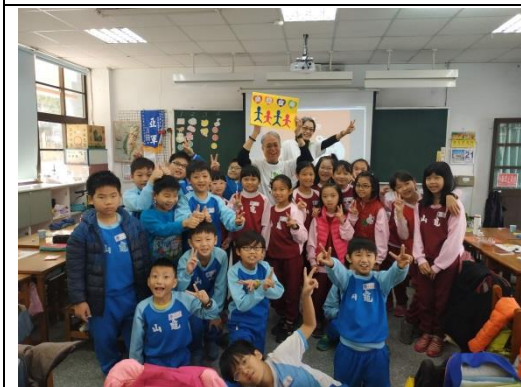
說明：項次 八 成果照片