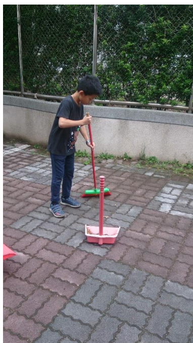
說明：項次一成果照片