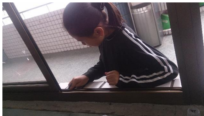
說明：項次一成果照片