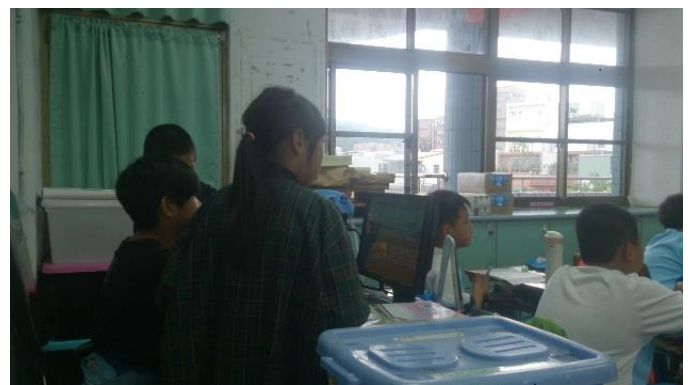
說明：項次三成果照片