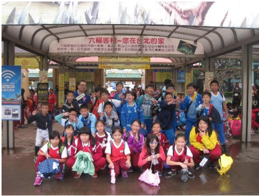
說明：項次二成果照片