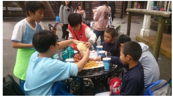
說明：項次二成果照片