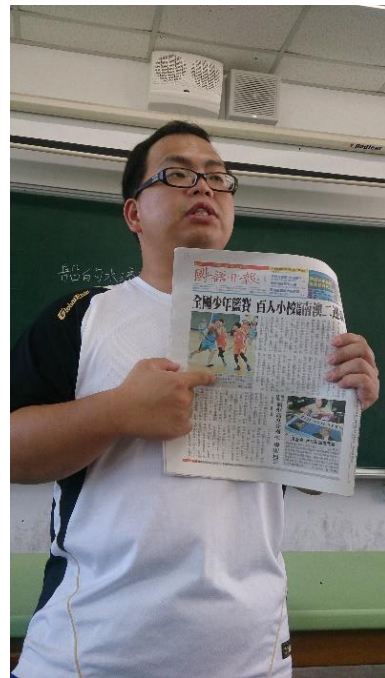
說明：項次二成果照片