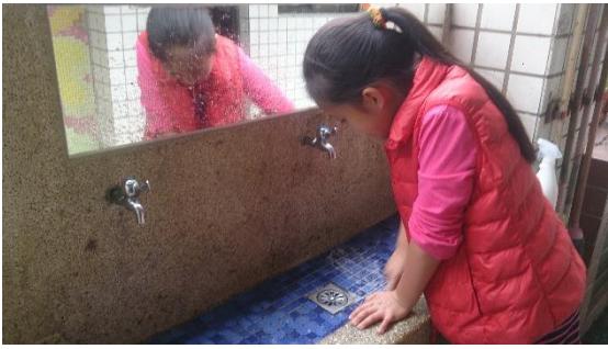
說明：項次一成果照片