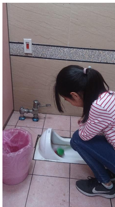
說明：項次一成果照片