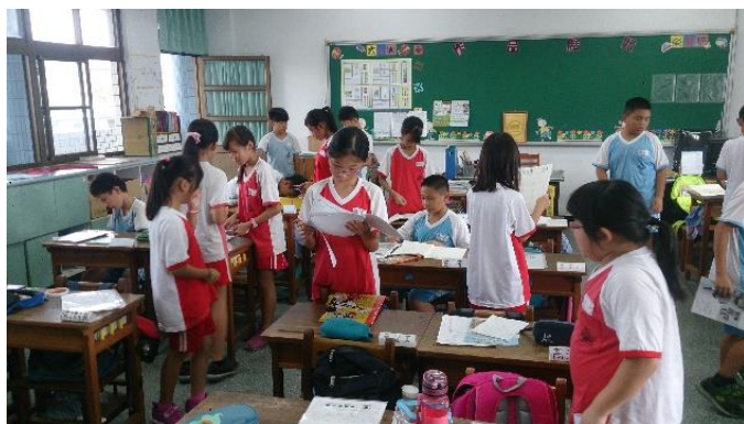
說明：項次三成果照片