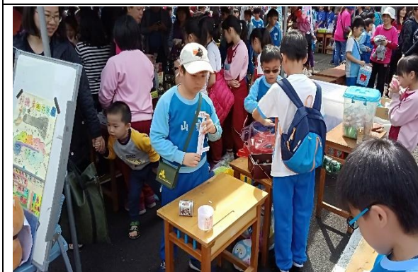
說明：項次 3 成果照片