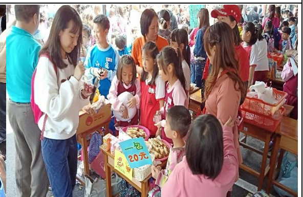
說明：項次 3 成果照片