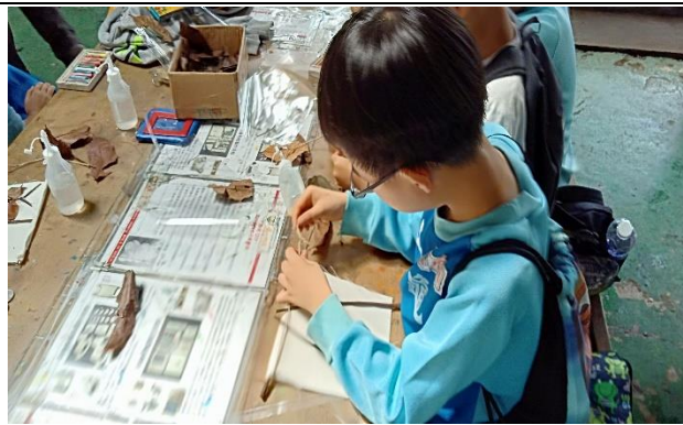
說明：項次 6 成果照片