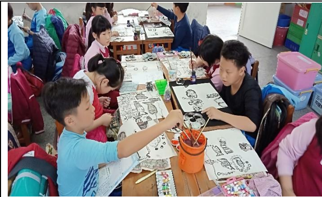
說明：項次 4 成果照片