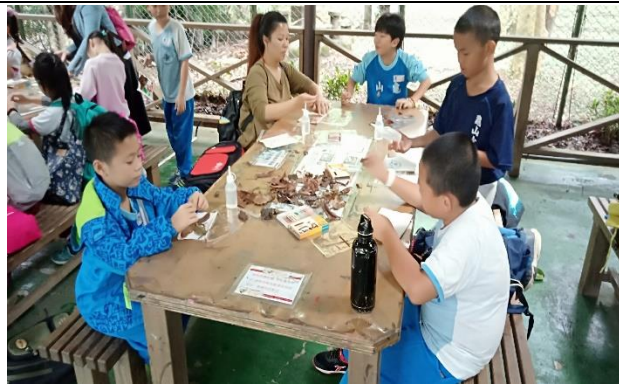
說明：項次 6 成果照片