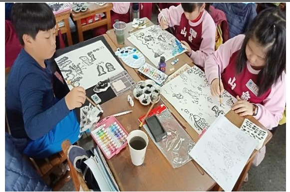
說明：項次 5 成果照片