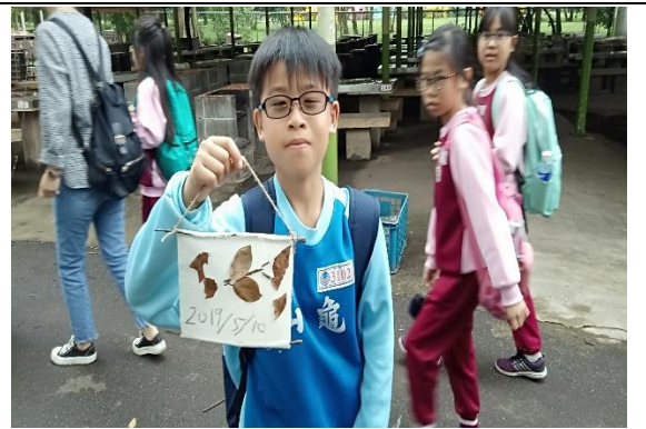
說明：項次 6 成果照片