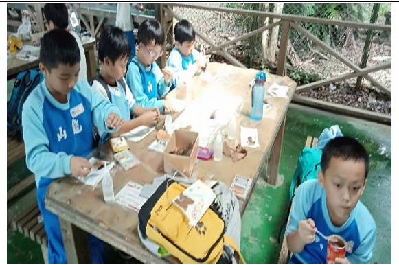
說明：項次 6 成果照片