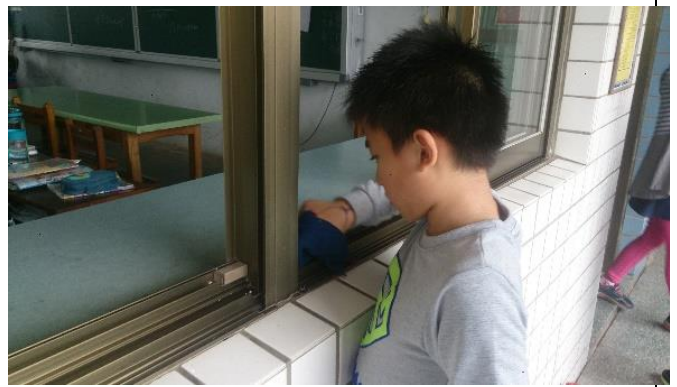
說明：項次二成果照片