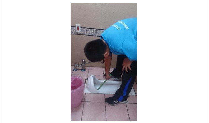
說明：項次三成果照片