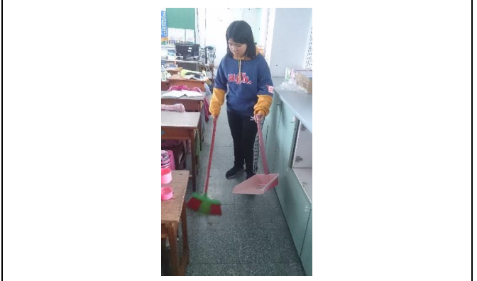
說明：項次二成果照片