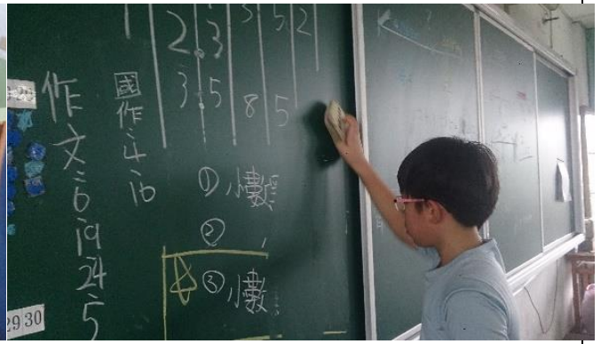
說明：項次二成果照片