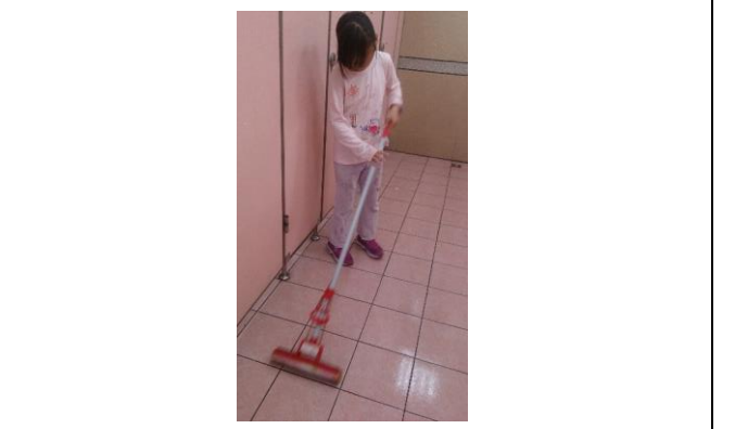
說明：項次三成果照片