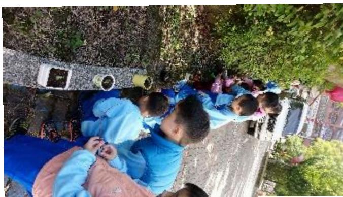
說明：項次四：我當爸爸媽媽了