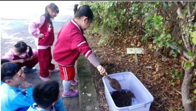
說明：項次四：我當爸爸媽媽了