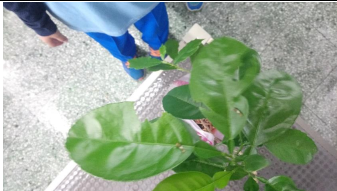
說明：項次二：觀察蝴蝶幼蟲與蛹