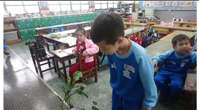
說明：項次二：觀察蝴蝶幼蟲與蛹