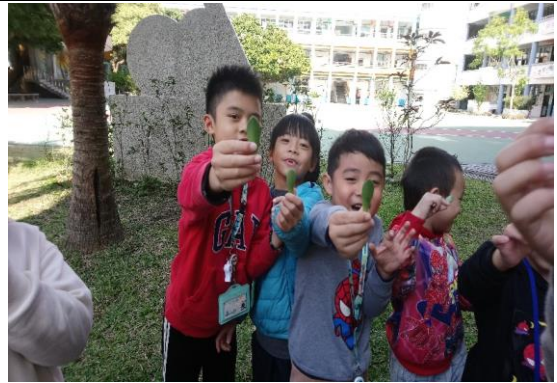
說明：項次三：養育石蓮花寶寶