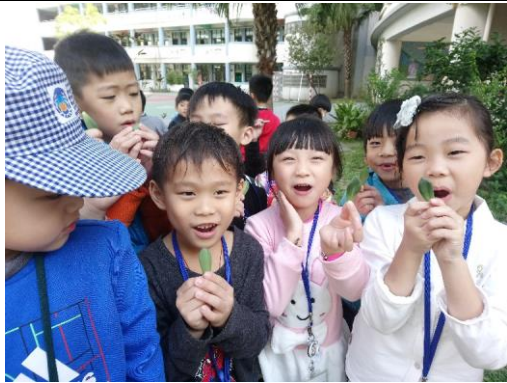
說明：項次三：養育石蓮花寶寶