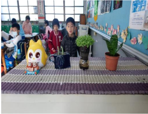
說明：項次一環境與植物