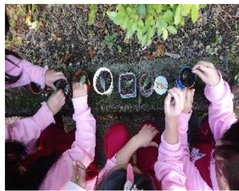
說明：項次四：我當爸爸媽媽了