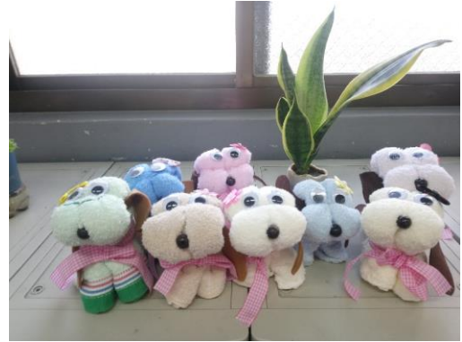
說明：項次一：環境與植物