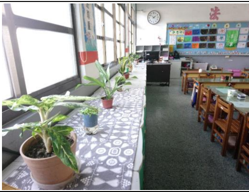
說明：項次一：環境與植物