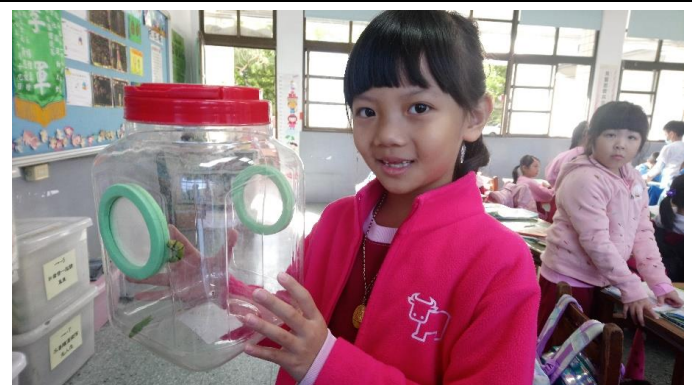
說明：項次三：觀察蝴蝶幼蟲與蛹