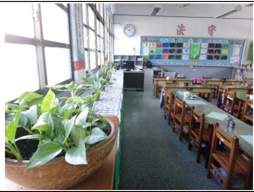
說明：項次一：環境與植物