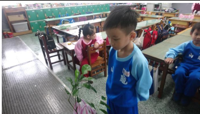
說明：項次三：觀察蝴蝶幼蟲與蛹