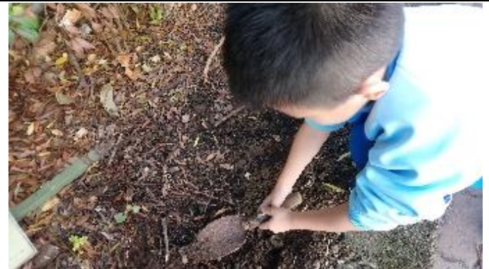
說明：項次四：我當爸爸媽媽了