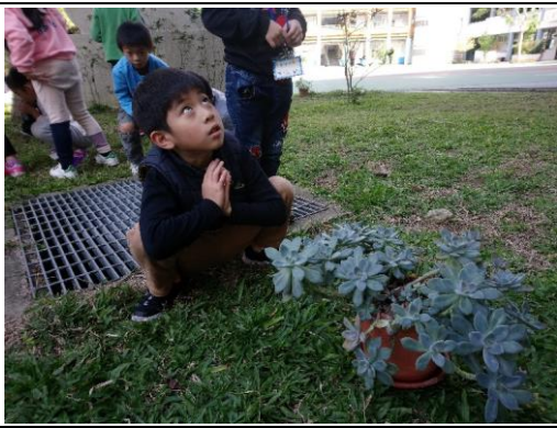
說明：項次三：養育石蓮花寶寶