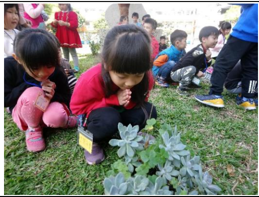
說明：項次三：養育石蓮花寶寶