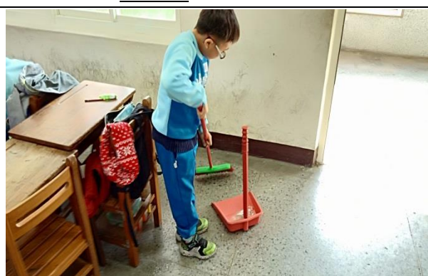
說明：項次 2 成果照片