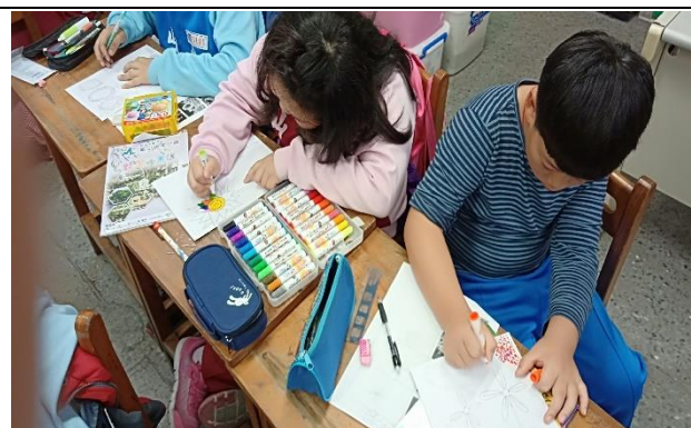
說明：項次 3 成果照片