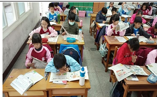
說明：項次 6 成果照片