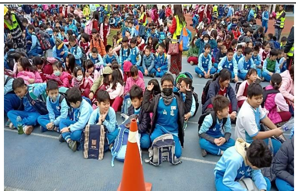
說明：項次 1 成果照片