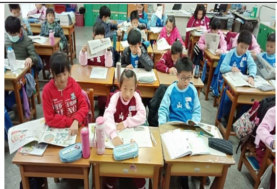
說明：項次 5 成果照片