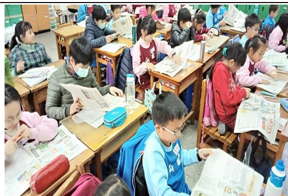
說明：項次 6 成果照片