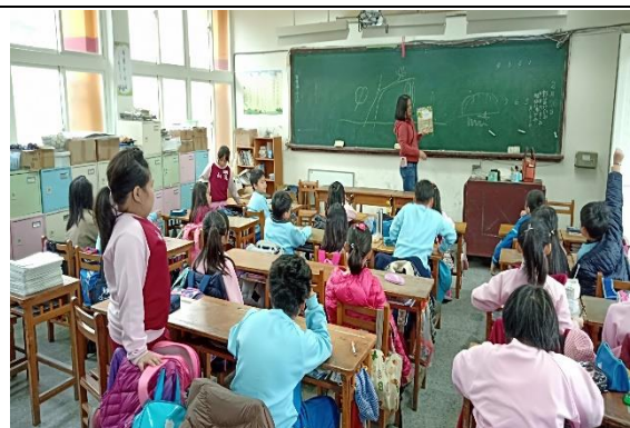
說明：項次 4 成果照片