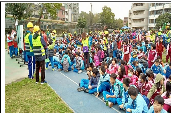
說明：項次 1 成果照片