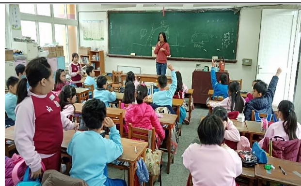
說明：項次 4 成果照片