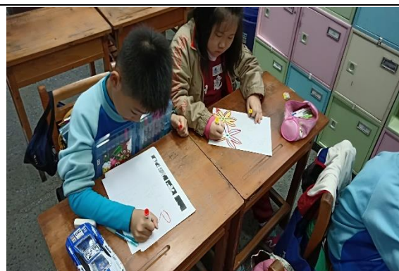
說明：項次 3 成果照片