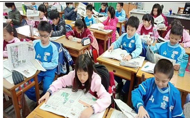
說明：項次 5 成果照片