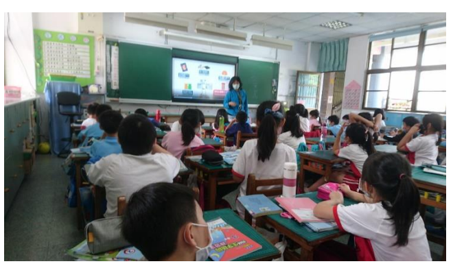
說明：項次 5 成果照片