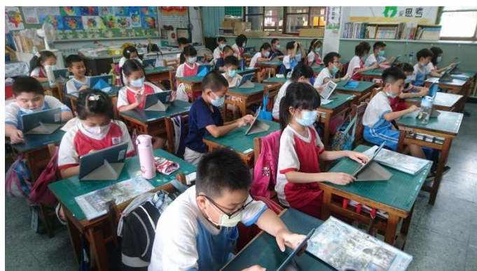
說明：項次 5 成果照片