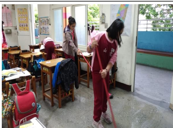
說明：用漂白水消毒教室