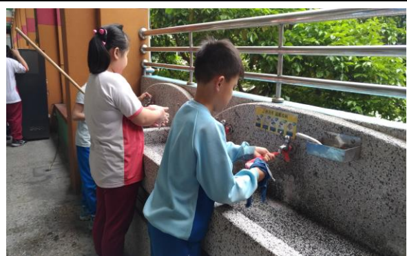
說明：防疫教育---正確洗手