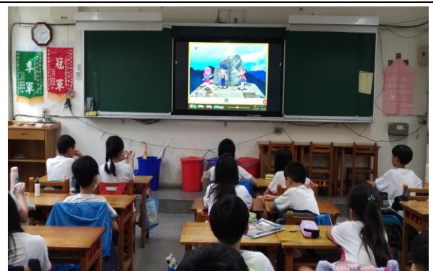
說明：影片欣賞及問題討論