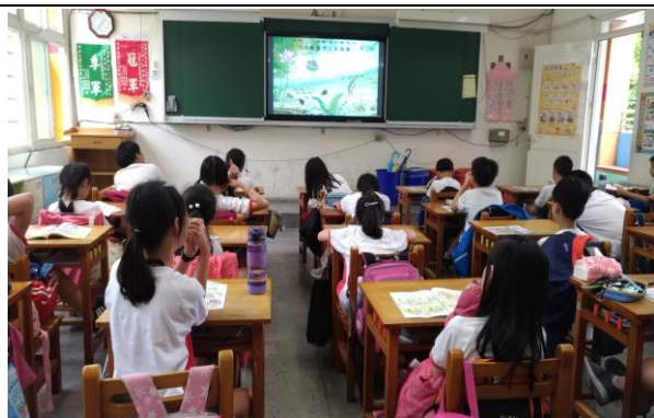
說明：影片欣賞及問題討論