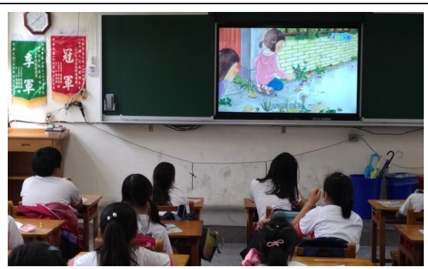
說明：影片欣賞及問題討論