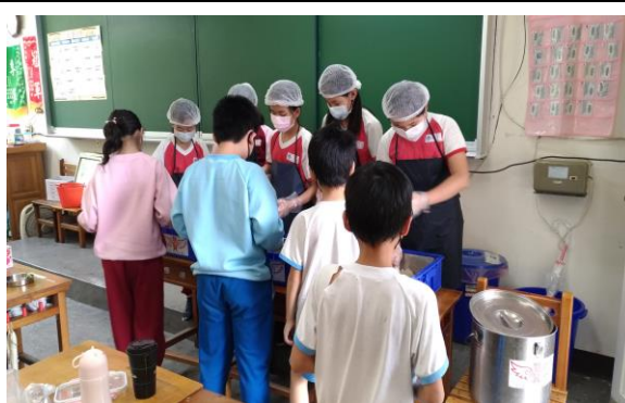
說明：防疫教育—用餐指導。