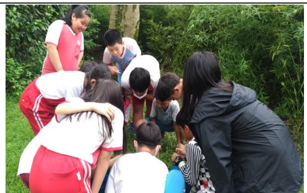
說明：校園植物觀察