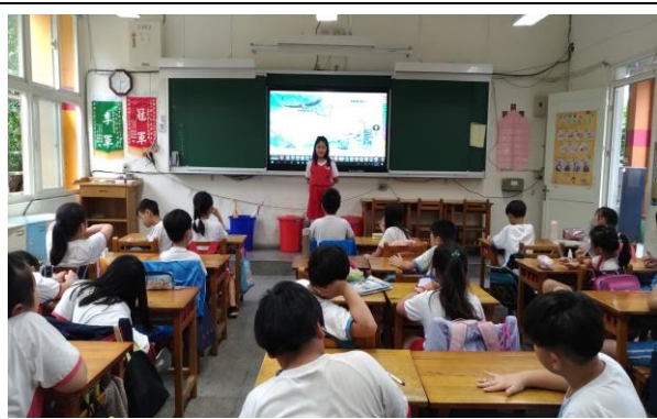
說明：課文探討及學童發表