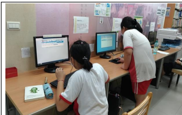
說明：利用電腦搜尋環境教育相關書籍