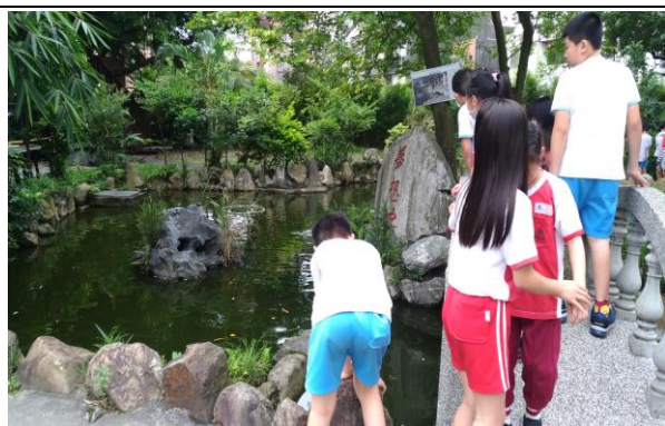
說明：觀察校園水中生物