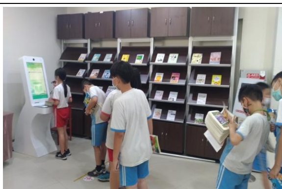
說明：體驗現代化科技對生活環境的影響