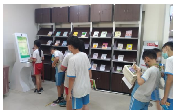
說明：體驗現代化科技對生活環境的影響