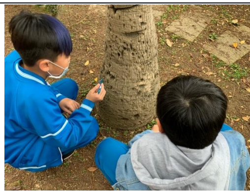
說明：項次 二 成果照片