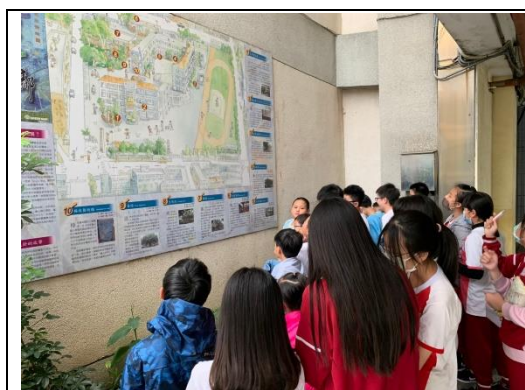
說明：項次 一 成果照片