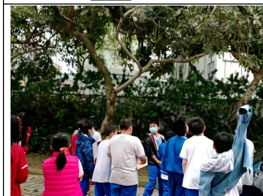
說明：項次 二 成果照片