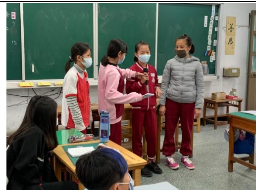
說明：項次 四 成果照片