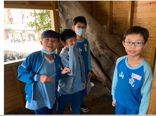
說明：項次 三 成果照片