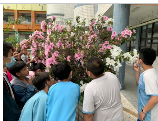
說明：項次 一 成果照片