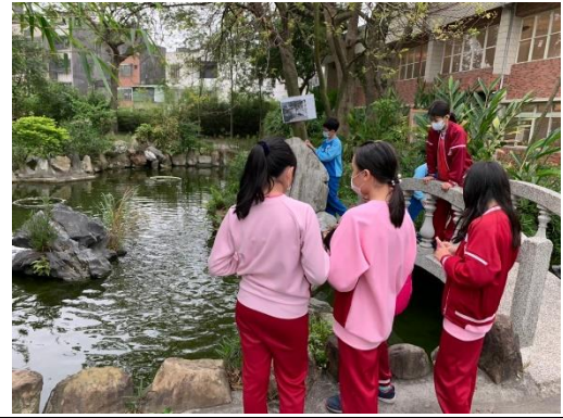
說明：項次 三 成果照片