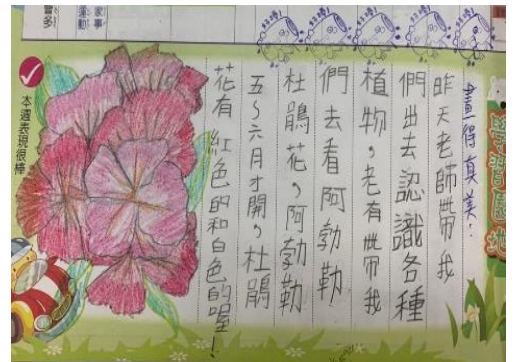
說明：項次 四 成果照片