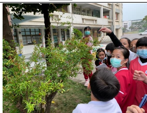
說明：項次 二 成果照片