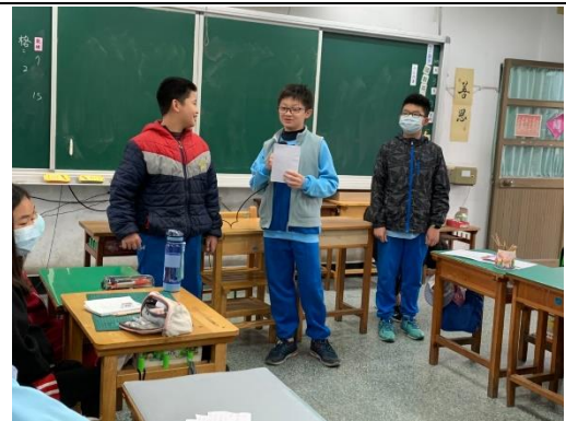
說明：項次 四 成果照片