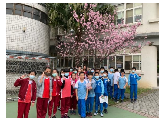
說明：項次 二 成果照片