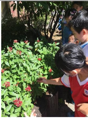
說明：項次_4_成果照片