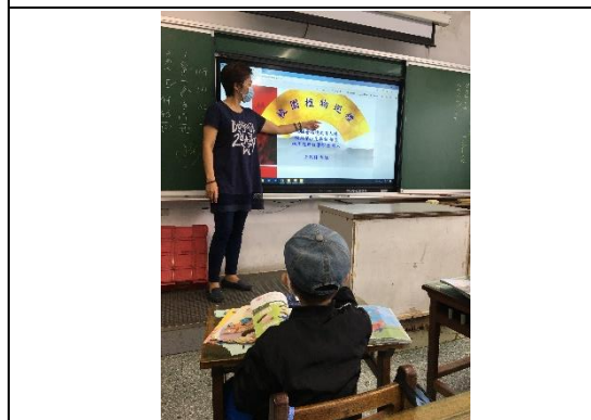
說明：項次 3 成果照片