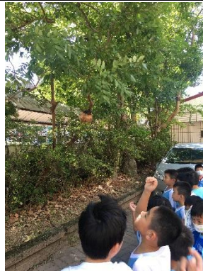
說明：項次_4_成果照片