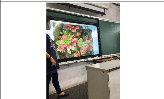
說明：項次 3 成果照片