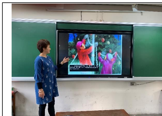
說明：項次 1 成果照片