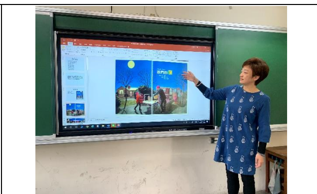
說明：項次 1 成果照片