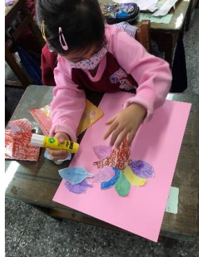
說明：項次_5_成果照片