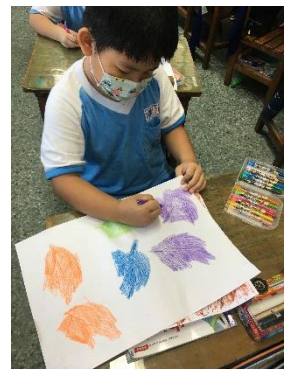
說明：項次_5_成果照片