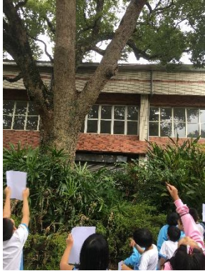
說明：項次_4_成果照片