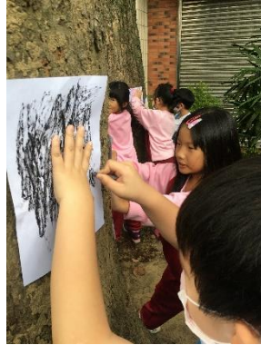
說明：項次_5_成果照片