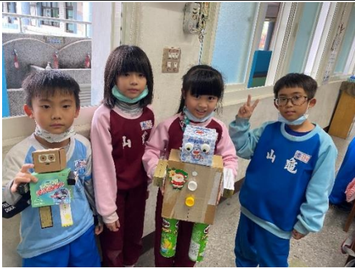
說明：項次 4 成果照片