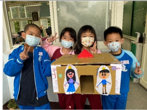
說明：項次 4 成果照片