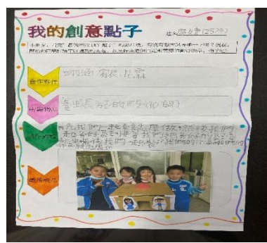
說明：項次 4 成果照片