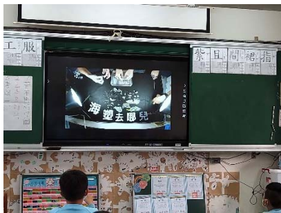
一-3 觀看影片了解海塑的種類與成因