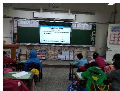
四-1 複習減塑的方法