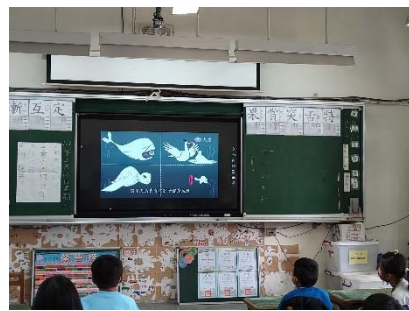
二-3 影片欣賞:垃圾對海洋生物的威脅