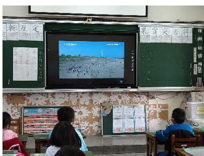
三-3 知曉目前人類減少垃圾之法