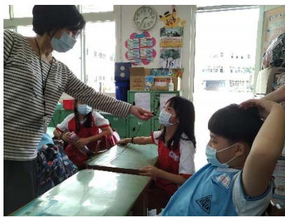
二-2 發表時間:垃圾對海洋生物有哪些影響?