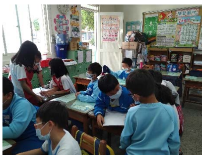
三-1 分組討論:減少垃圾的方法