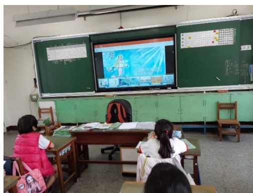
說明：項次一： 小美人魚藻不到 共讀