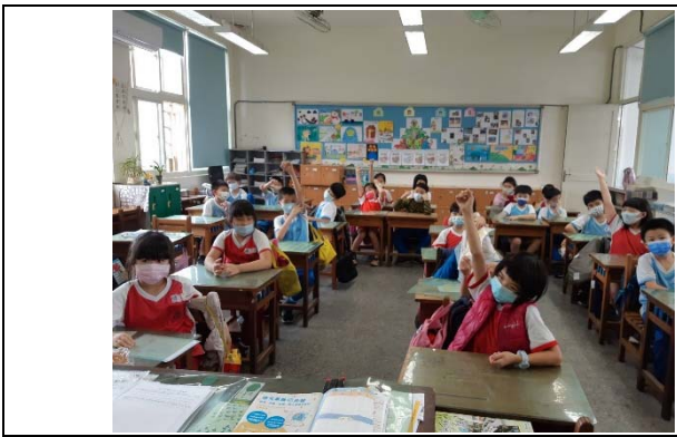
說明：項次二： 老師 提問和學生回答