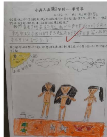
說明：項次三：【 分享學習單 】