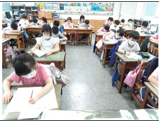
說明：項次三： 認真寫 【學習單】