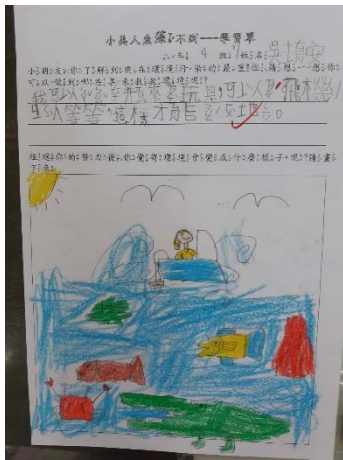
說明：項次四：【 分享學習單 】